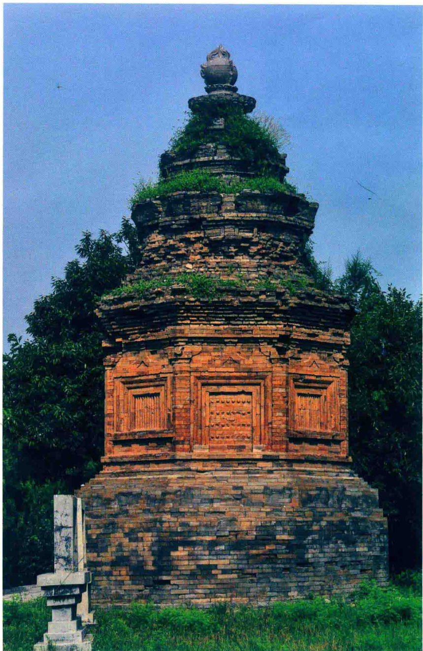
净藏禅师塔（唐）登封市