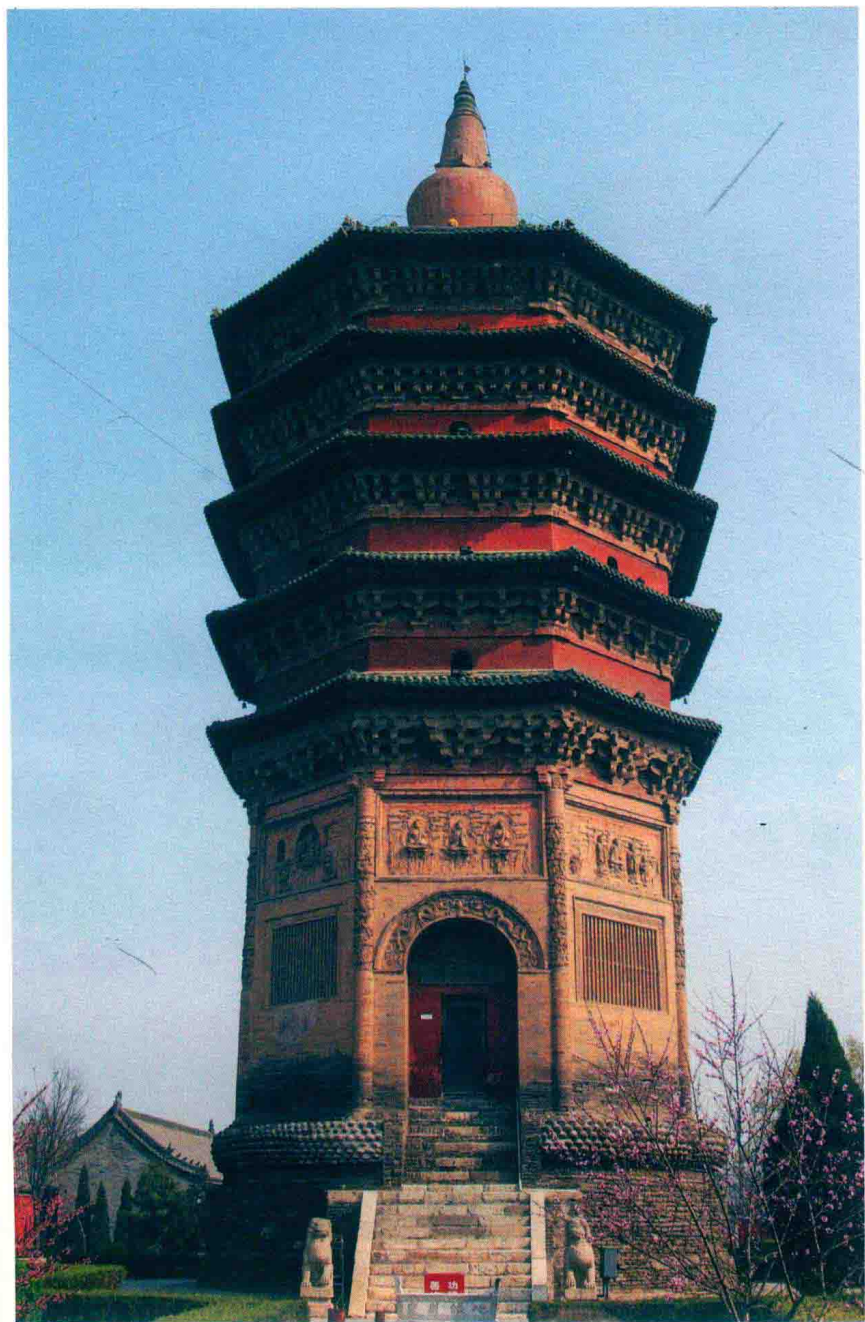
天宁寺塔（五代至清）安阳市