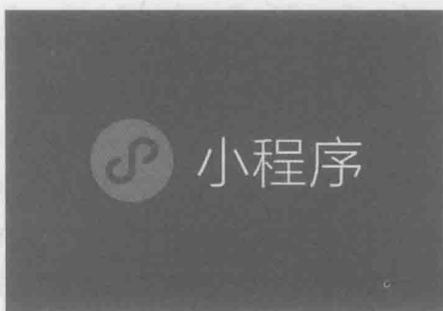
图 1-1 微信小程序的图标

微信小程序于 2017 年 1 月 9 日凌晨正式上线，它是一种无须下载、安装，只要点击进入即可使用的移动应用，而且部分小程序甚至可以达到媲美原生应用程序。也正因如此，许多人直接将微信小程序称为“简化版的 APP”。图 1-1 所示为微信小程序的图标。