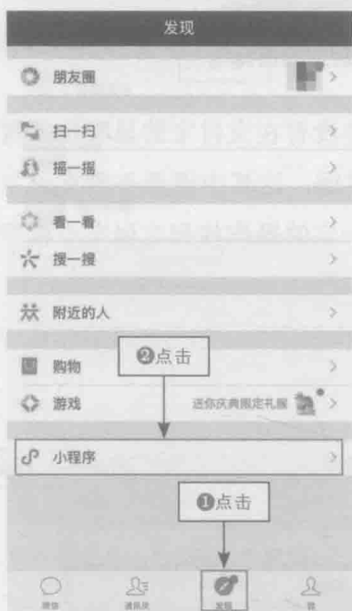
图 1-2 “发现”界面