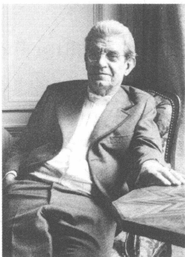
雅克·拉康 (Jacques-Marie-Emile Lacan, 1901—1981)

拉康使得回到弗洛伊德成为可能。他取代了父亲的角色，借助于自己的超凡魅力，大声宣布自己的律令，分配美差，分封诸侯，即使冒了这样的危险也在所不辞：把自己的忠实追随者变成自己的简单复制品。但是与此同时，拉康使精神分析学在法国取得了无可争议的胜利，精神分析进入了自己的黄金时期。