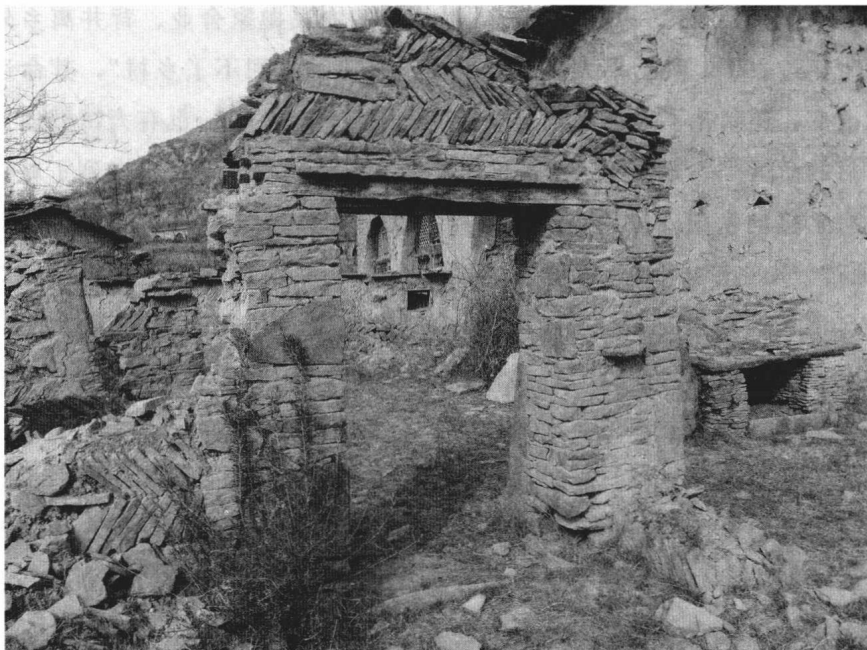
这是陕北延川县的一个古村落——甄家湾村，如今已经人去楼空。偶有参观者路过停留参观，有些拍摄电影和电视剧的剧组，常来村里利用这些老房子当道具和拍外景。

文化结构破坏致使村落共同体解体；城镇的吸引与乡村基础设施落后导致的城乡关系失调，迫使年轻人大量外出等，都是村落衰败的重要原因。乡村价值理论主张发现乡村价值，理解乡村价值体系，从乡村体系内部考察乡村衰落的原因，寻找乡村振兴路径。从乡村价值视角看乡村，一些原本被视为缺陷的要素可能是稀缺资源。比如，工业化程度低被认为是乡村发展的劣势，但也因此保留了青山绿水和良好的生态；人多地少被认为是劣势，但为发展精细农业、地方手工业和乡村融合产业提供了基础和条件；生活方式“落后”被认为是劣势，但可能正是这种所谓的“落后”才保存了宝贵的乡村文化和习俗，成为乡村进一步发展的宝贵资源。乡村价值理论主张要沿着乡村固有价值系统安排乡村建设项目。乡村振兴不是着眼于乡村缺少什么和不能干什么，而是着眼于乡村有什么优势和能够做什么；不是伸手等着外来的支持和援助，而是激发乡村自身的活力。从某种意义上说，乡村价值理念的乡村振兴重视的是乡村原住居民的主体地位和乡村的已有资源。重视乡村自身价值，并不是排斥外来要素，外来要素可以为乡村系统注入