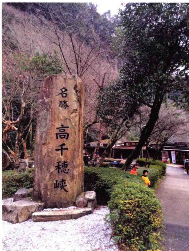
| 传说中天孙降临的地点