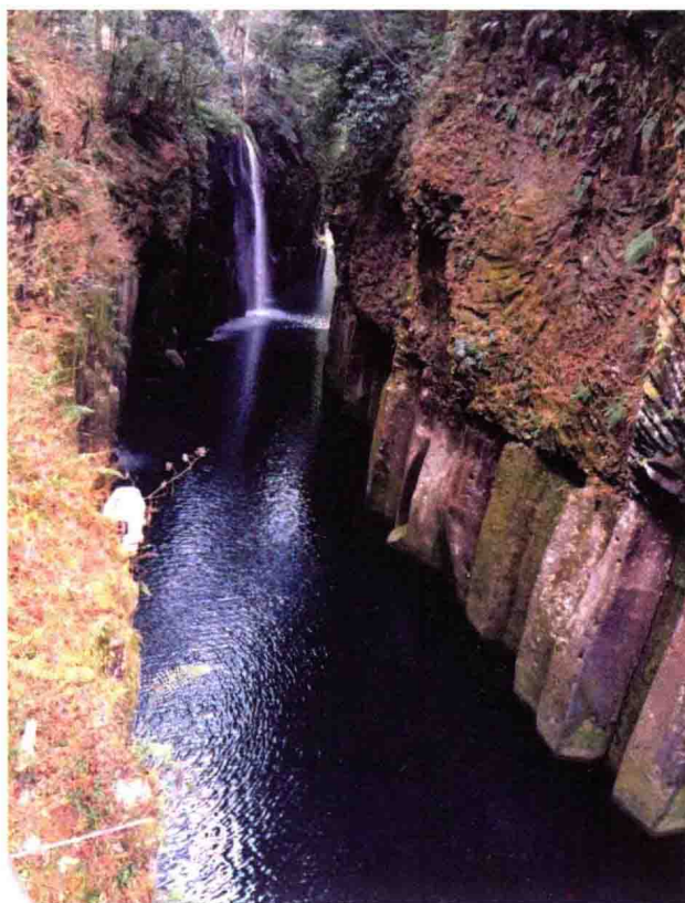
| 传说中天孙降临的地点