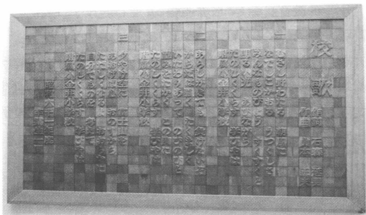
图 1-3 小金井小学校歌

1964年,由石森延夫作词,山本正夫作曲,小金井小学校歌诞生。歌词一共三段,分别歌唱了学校的办学思想、学生成长的方向等,每一段的最后一句都是“附属小金井小学,是我们快乐生活学习的地方”,体现了学生们对小金井小学无限向往和美好回忆。