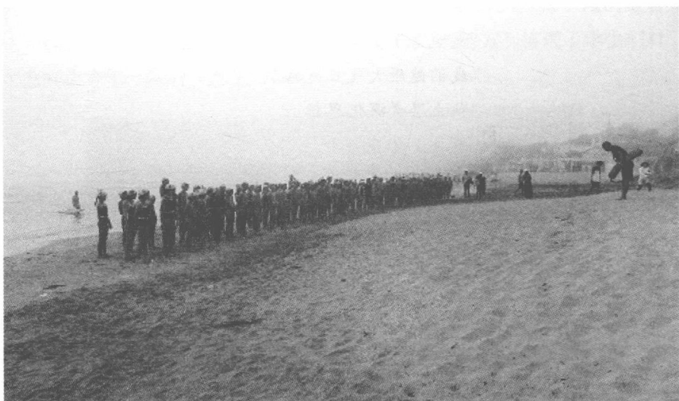
图 1-4 小金井小学的“亲近大自然”集训活动

二是教育研究基地。作为实证研究的重要一项,小金井小学定期开展研究课。例如“培养爱思考、富有创造力的孩子”的研究,注重每个学生的想法及其与同学的交流和合作。