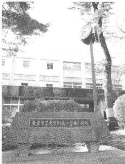
图 1-1 小金井小学玄关

近年来,日本女子足球队也以抚子花作为别名,抚子花的性格和意义在日本得到了普遍的认同。