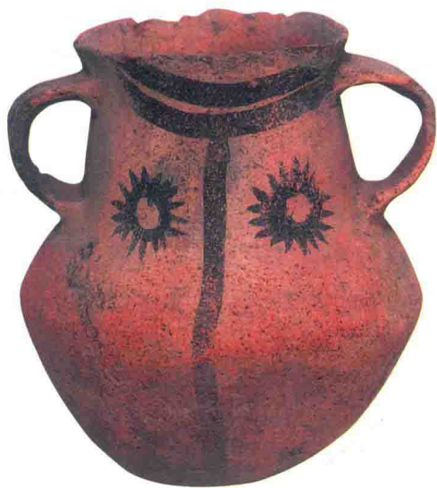
彩陶太阳纹罐，高 16 厘米，直径 17 厘米，1999 年甘肃临洮出土，距今 3100 年—3400 年前后

对太阳的崇拜不仅表现在绘画、石刻上，而且还将太阳赋予了神性。人们通过各种仪式来表达对太阳的虔敬之心，希冀得到太阳的庇护。有些地区直到现在还有人在太阳升起的时候向太阳作揖、跪拜。崇日仪式自古就有，后经不断规范，形成了在固定时间、固定地点举行的祭日仪式。中国历朝历代都很重视祭日仪式，在明、清两代达到高潮，每年春分这一天都要举行祭日大典，或皇帝亲祭，或由大臣代祭。