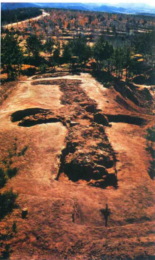
牛河梁女神庙遗址

从远古到文字出现之前的这段漫长的时间里，中国人信仰的表现形态多为自然崇拜、灵魂崇拜、图腾崇拜、生殖崇拜和祖先崇拜等。各种崇拜及其发展脉络一般都经历了从参与具体崇拜活动到抽象神灵观念形成的演变过程。