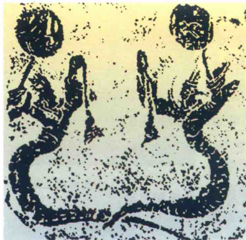
《伏羲女娲手举日月图》，四川合江张家口二号墓出土