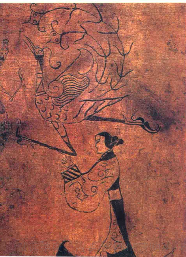
湖南长沙楚墓出土的帛画《龙凤仕女图》。画面主旨是祈求奋飞向上的龙凤引导墓主的灵魂早日升仙

图腾产生于氏族形成之后，原始人相信每个氏族都与某种动物植物或其他自然物有着特殊关系，一般以动物居多。作为氏族图腾的动物（如熊、狼、蛇……），既是该氏族的神圣标志，也为该氏族之忌物，禁杀禁食。将图腾作为神圣标志，氏族要举行崇拜仪式，以促其繁衍。图腾崇拜把人的灵魂思想、鬼魂观念及祖先崇拜等转移到了动植物等自然物上，当然，这种转移又同他们的原始生活（即狩猎）及原始农耕密切相关。