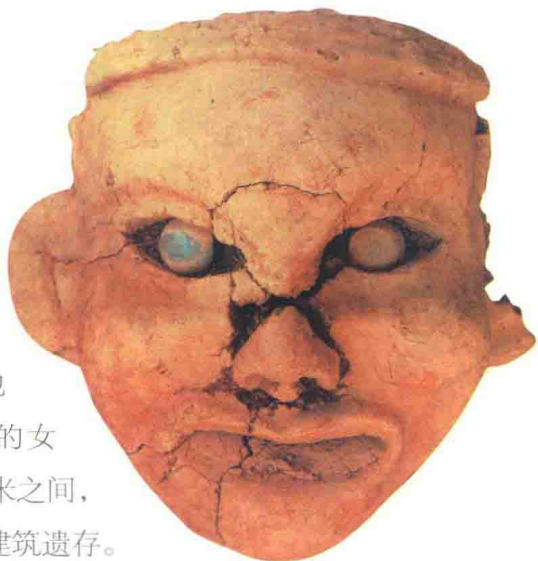
牛河梁女神庙遗址出土的泥塑女神头像

在中国辽宁一个叫牛河梁的地方，有一座距今5000—6000年前的女神庙。女神庙长约22米，宽在2至9米之间，平面呈“亚”字形，属于半地穴式建筑遗存。