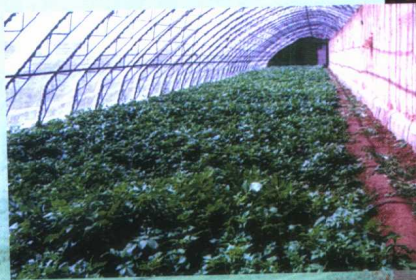
元宝山区蔬菜基地