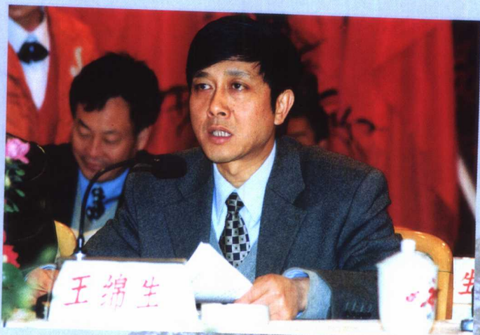
中共游仙区区委书记王绵生在绿色产业示范区工作会上讲话