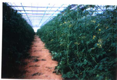
定州市高标准无公害蔬菜生产基地温室