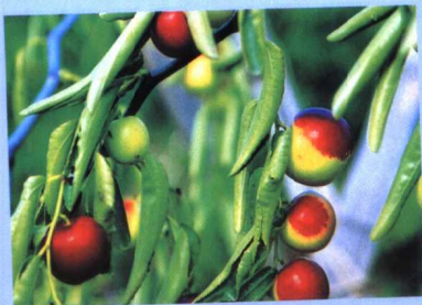
黄河口独有的佳果——冬枣