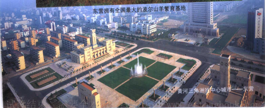
黄河三角洲的中心城市——东营