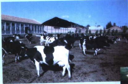
元宝山区振华奶牛养殖场