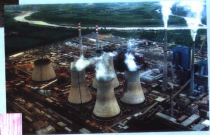
总装机 210 万千瓦的元宝山发电厂