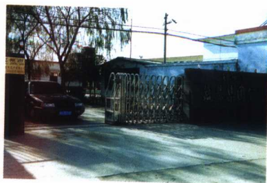
定州市蔬菜集团公司