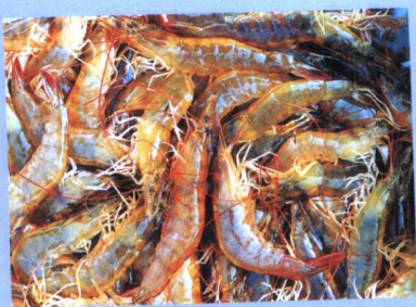
黄河口独有的东方对虾