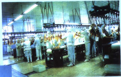
内蒙古草原兴发股份有限公司 绿乌鸡加工生产线