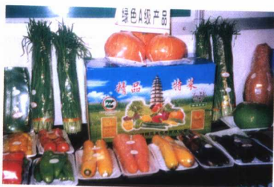
定州市生产的国家级 A 级绿色产品