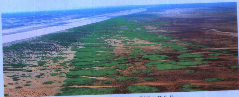
共和国最年轻的土地——黄河口新生地