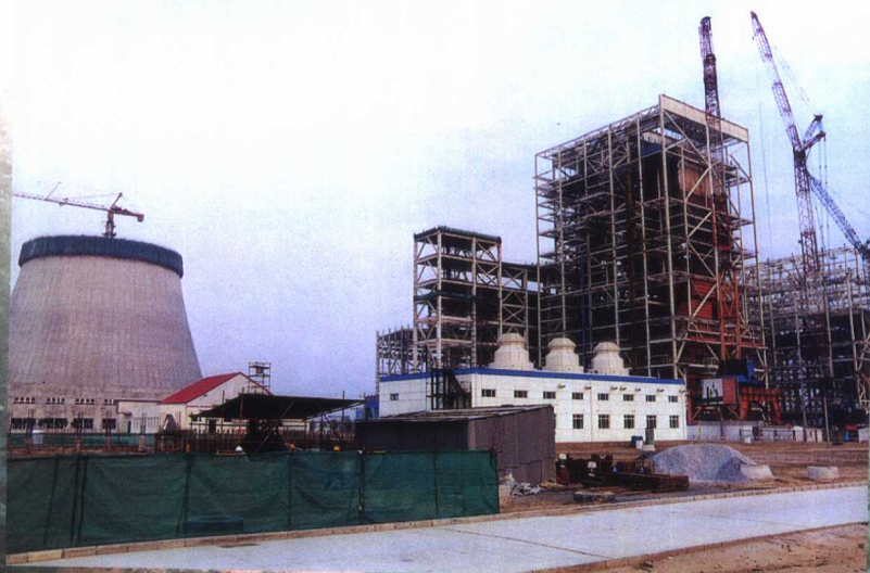
规划装机 2400MW 的定州电厂 2004 年 5 月投产