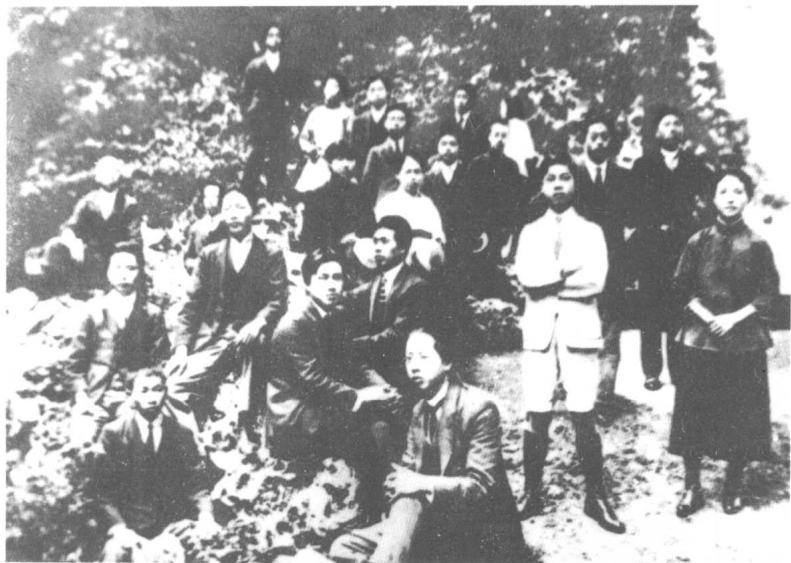
蔡和森(后排右二)、 向警予(第二排右一)等赴 法勤工俭学学生于1920年 在蒙达尼城公园合影