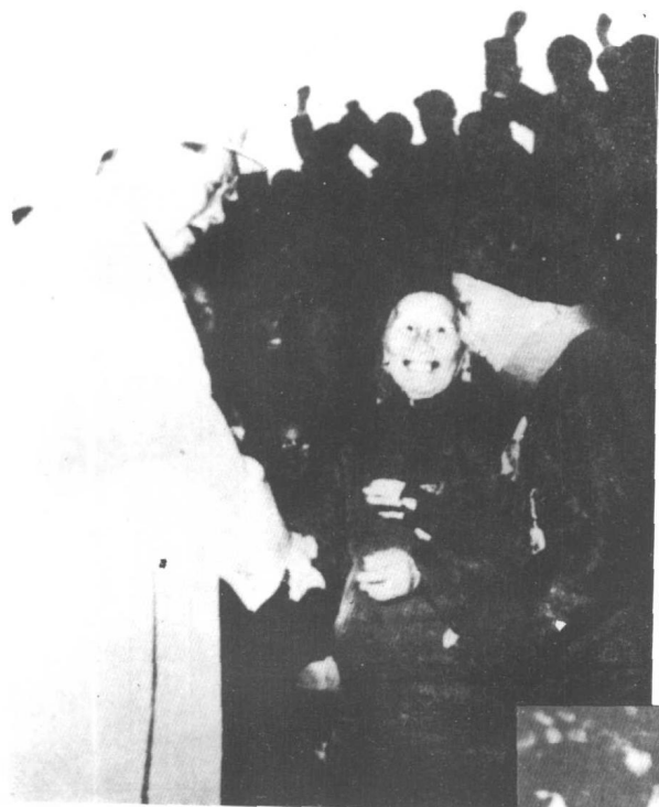
1956年毛泽东接见彭湃的母亲 ——彭老太太