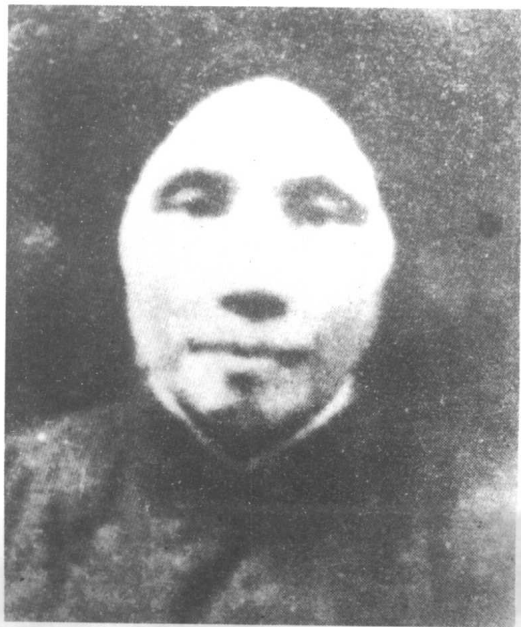
蔡和森之母——葛健豪烈士