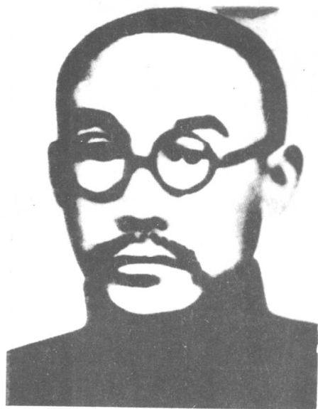
左上:何叔衡——“我为 苏维埃流最后一滴血”