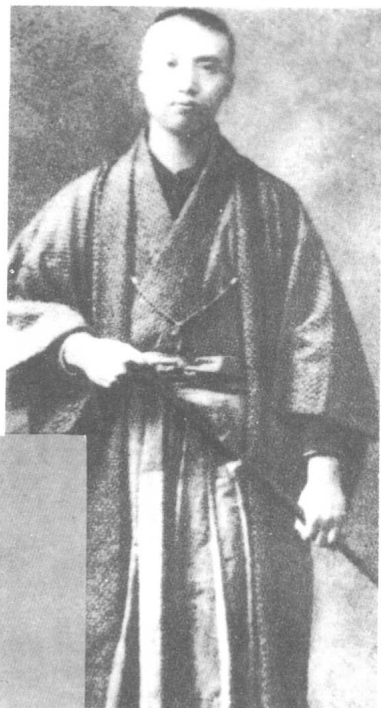
青年时期的李大钊