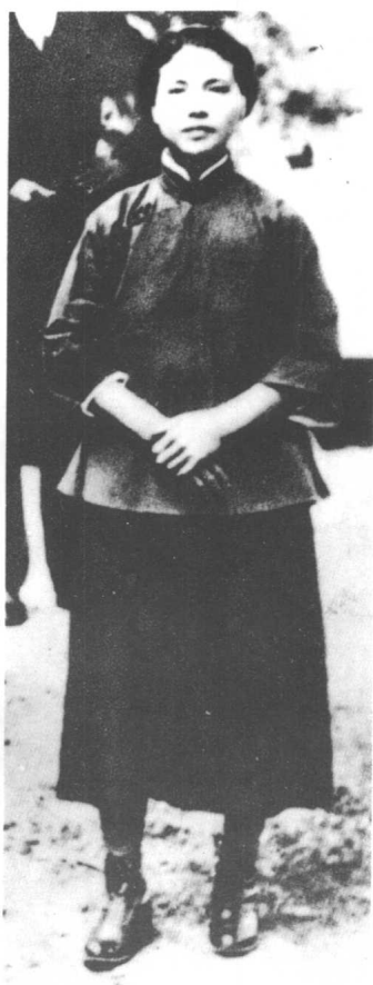
1920年向警子在法国蒙达尼