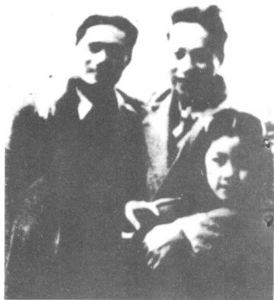
右上:叶挺、邓发(左)在 重庆,前立者为叶挺之 女扬眉