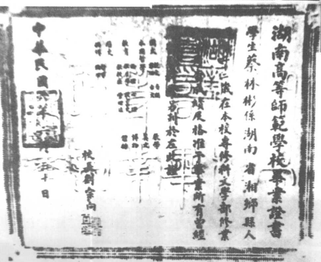
蔡和森在湖南 高等师范学校专修 科文学部的毕业证 书