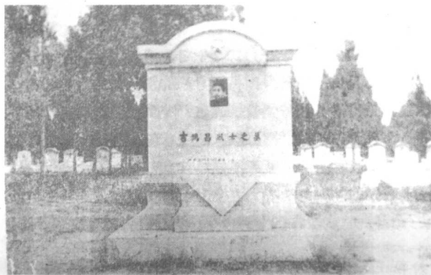
吉鸿昌墓 (位于郑州烈士陵园)