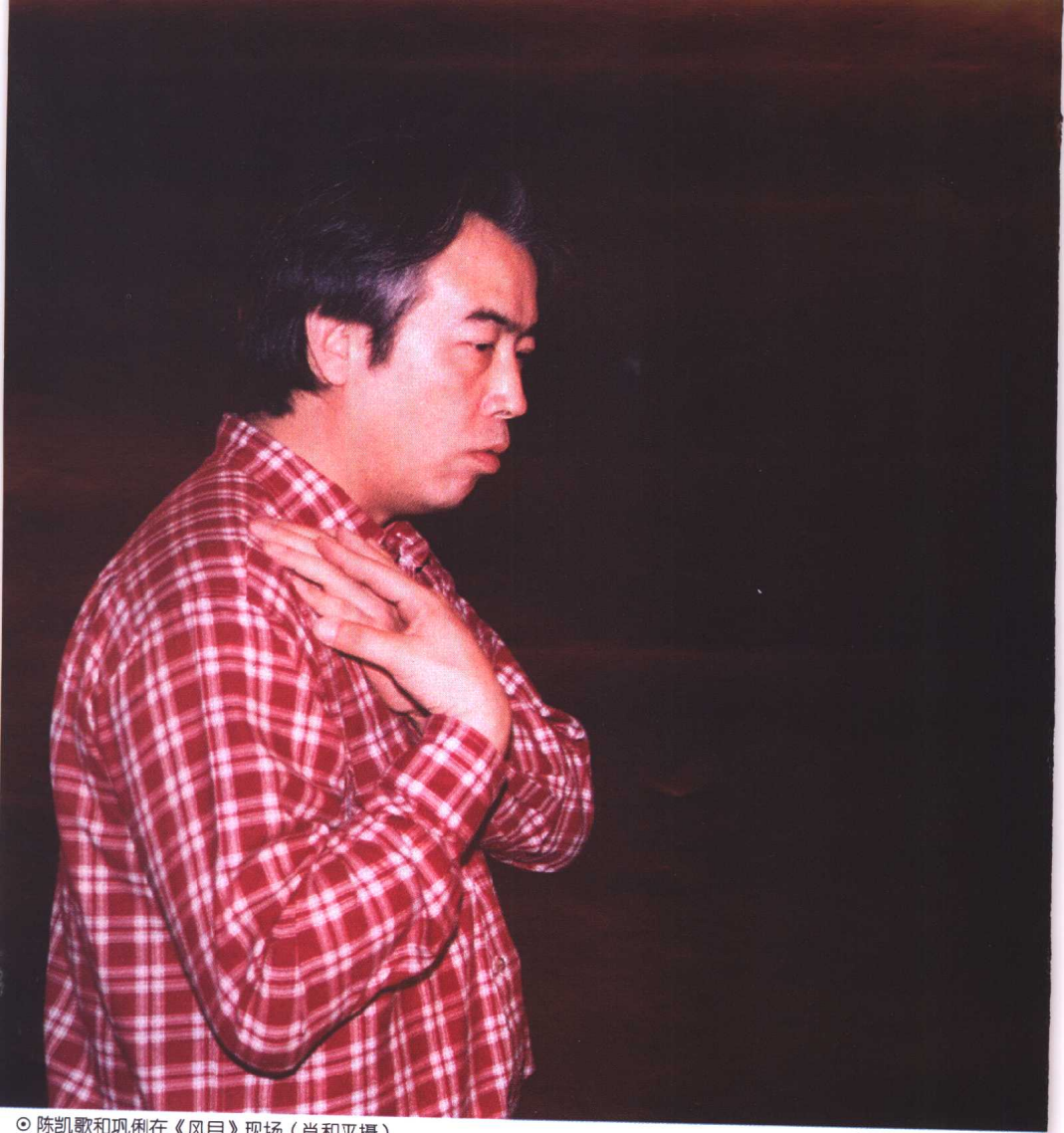
◎ 陈凯歌和巩俐在《风月》现场