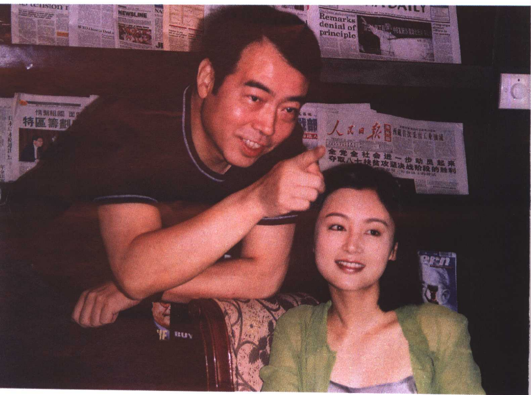
◎ 陈凯歌和陈红