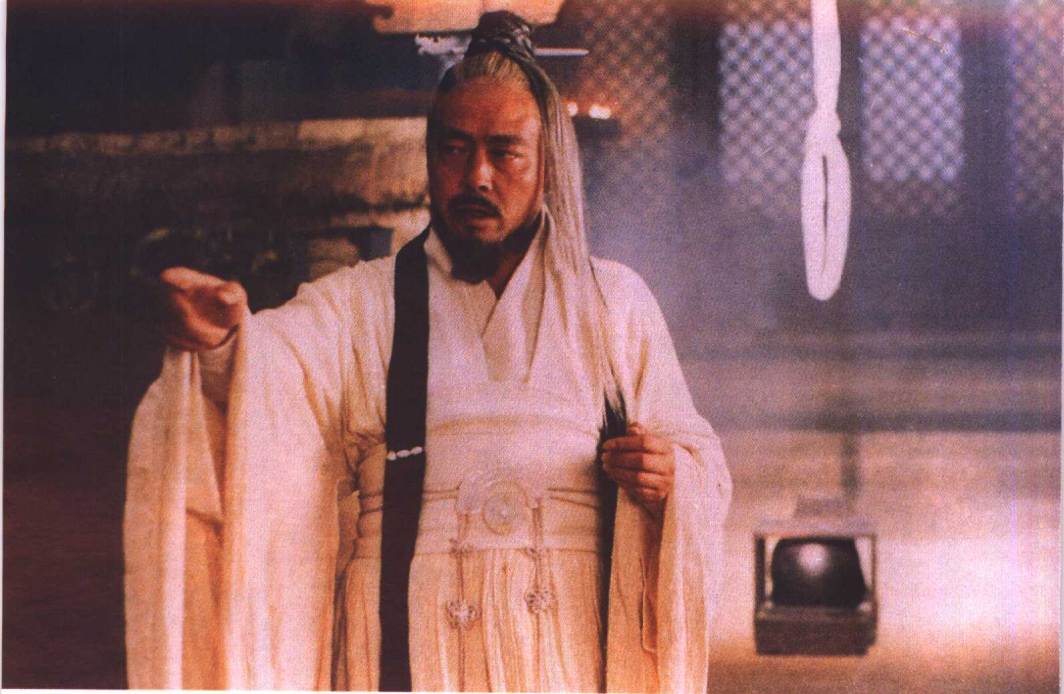
◎ 陈凯歌在《荆轲刺秦王》中饰吕不韦