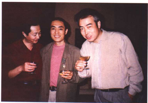
◎上：陈凯歌和张艺谋、陈冲、田壮壮相聚