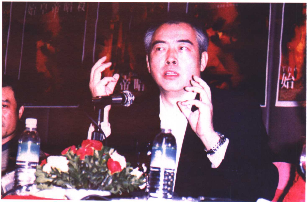
◎上左、上右：陈凯歌在香格里拉饭店咖啡厅与笔者交谈