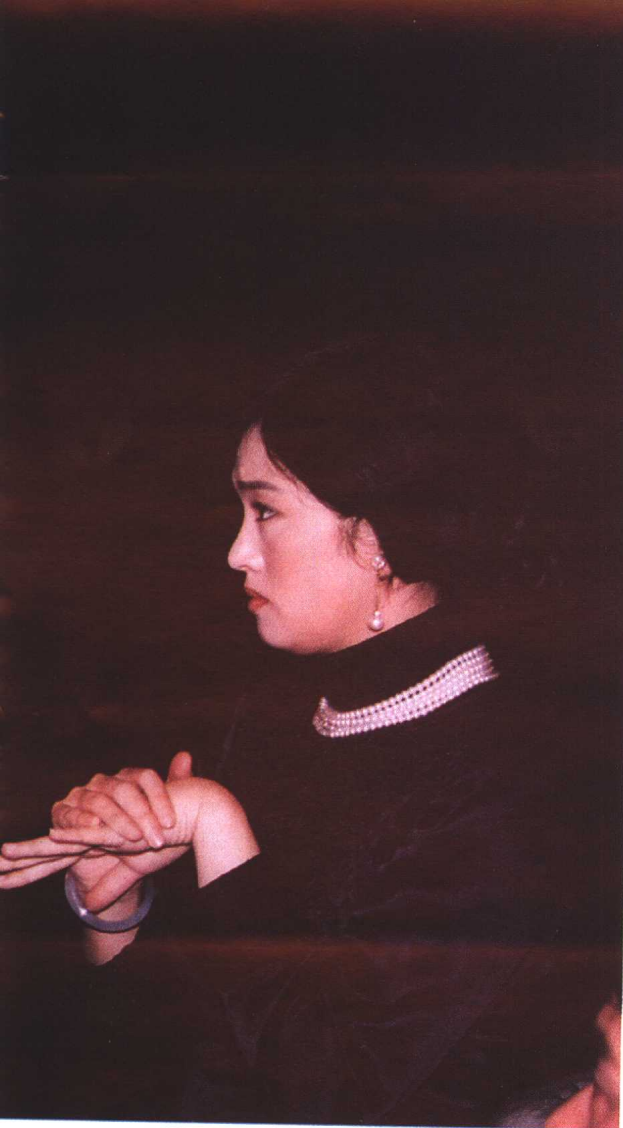
◎ 陈凯歌和巩俐在《霸王别姬》现场