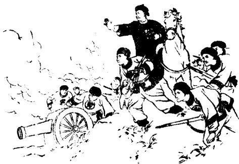
左寶貴親自指揮軍隊抵抗日軍

軍隊守住平壤北城的玄武門。九月十五日，日本集中兵力向玄武門猛攻，左寶貴親自站到城牆上指揮軍隊抵抗。後來左