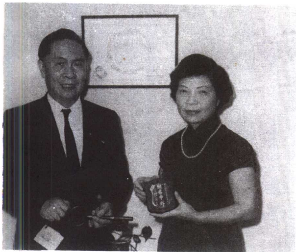
◀一九七二年在美國加州演奏後接受州政府獎狀、金鎖匙和華僑贈送的“馳名中外”金盾