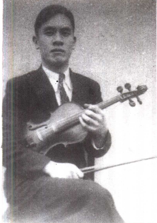
◀ 1931 年学成归国后的马思聪