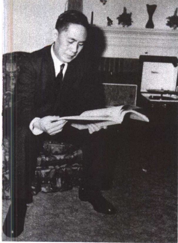
▲在美国寓所阅读乐谱