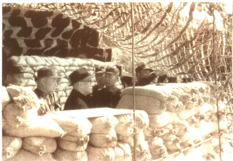
蒋介石晚年在金门岛的掩体里，遥望大陆