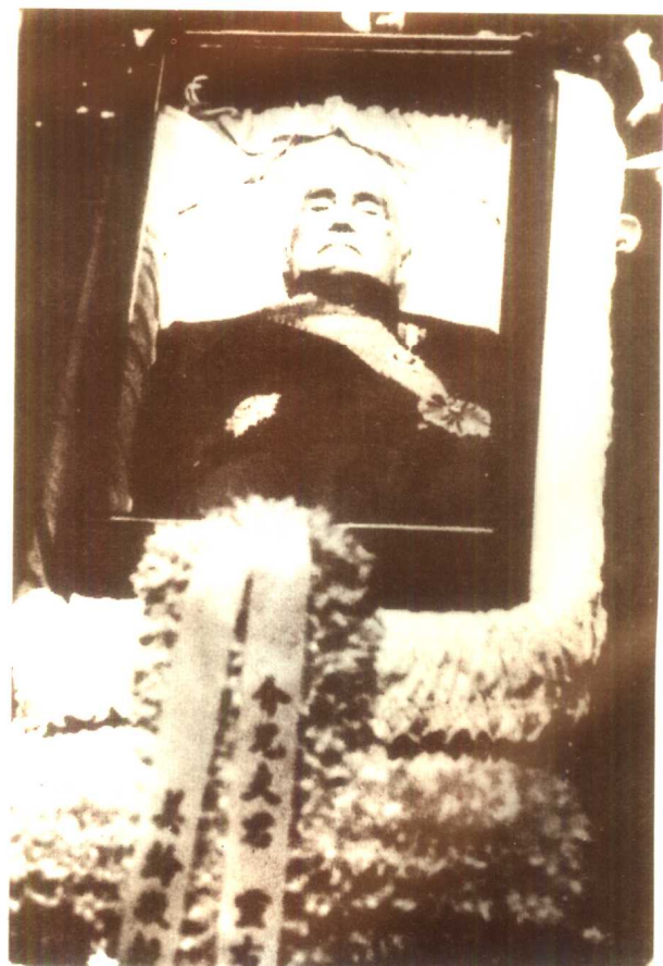
1975年4月5日,蒋介石突发心脏病在台北寓所逝世,终年88岁