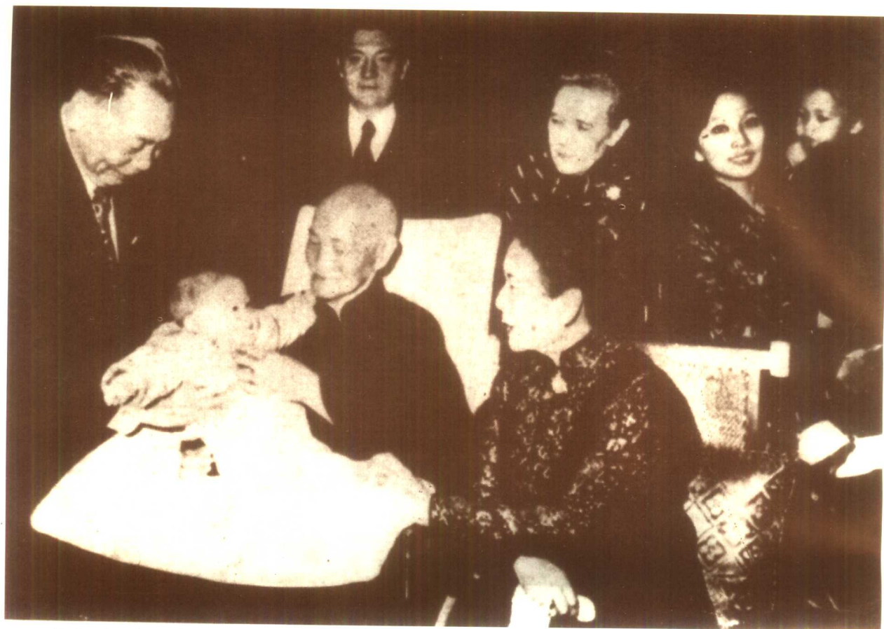
蒋介石、宋美龄晚年弄曾孙之乐