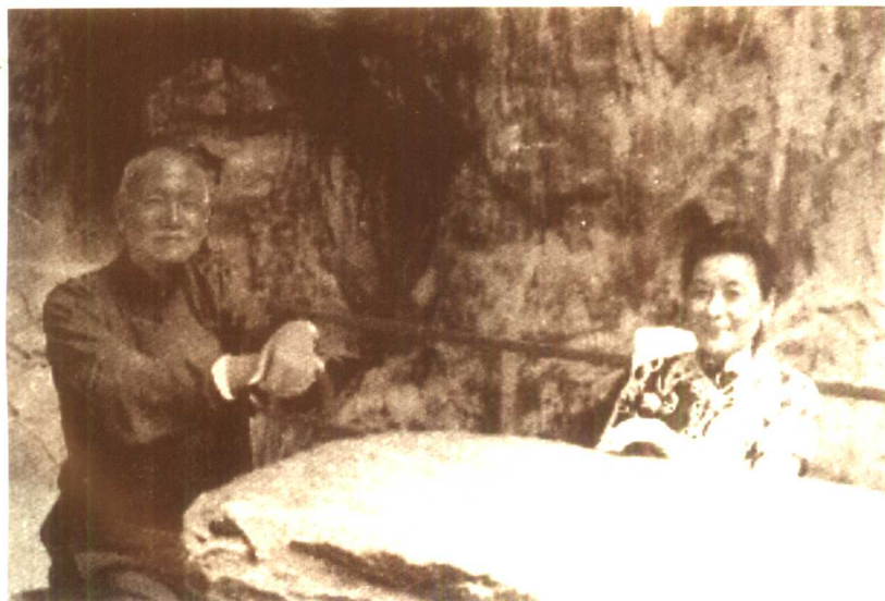
蒋介石与宋美龄移情山水