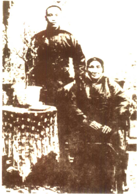
蒋介石与其母王采玉