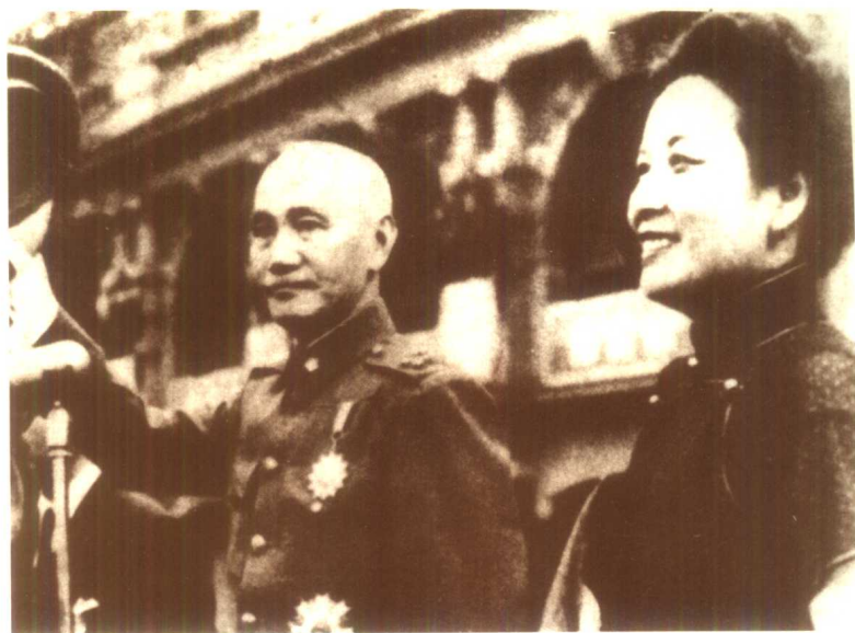
一九五零年三月一日，蒋介石在台湾宣告复任总统、 蒋介石与宋美龄在复职仪式上