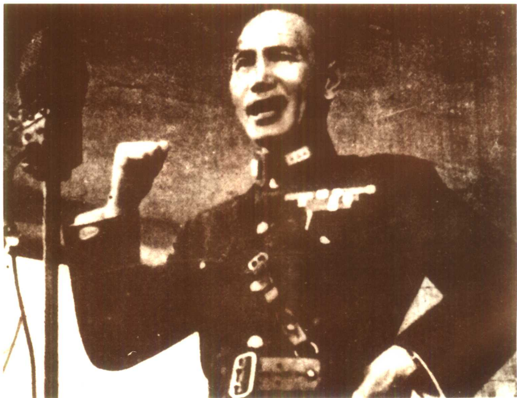
一九三七年七月十七日，在庐山发表对日抗战讲话时的蒋介石