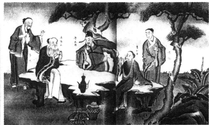
饮中八仙图(中为李白)