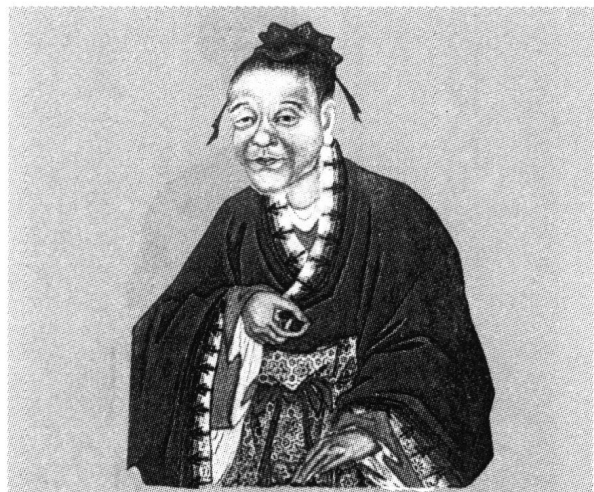
李德裕司马迁画像