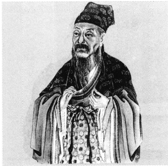
陶渊明司马光画像