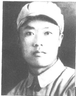
1953年秋末，作者伤愈，在黑龙江省安达县城（今大庆市）东北军区健康第五团留影。