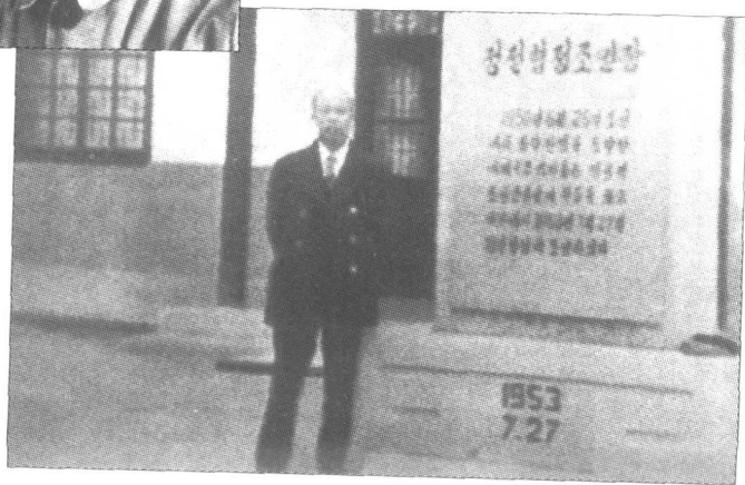
1983年11月，作者访问朝鲜时在开城板门店停战协定签字处留影。