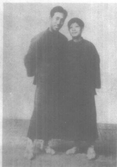
彭湃烈士和 他的妻子许玉卿 同志。