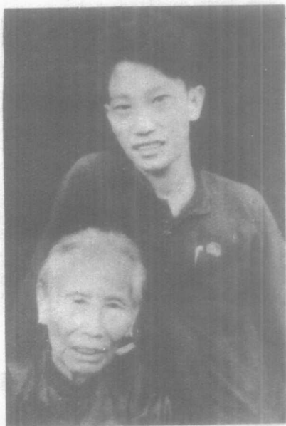
少年时代的 彭湃烈士和 他的母亲。