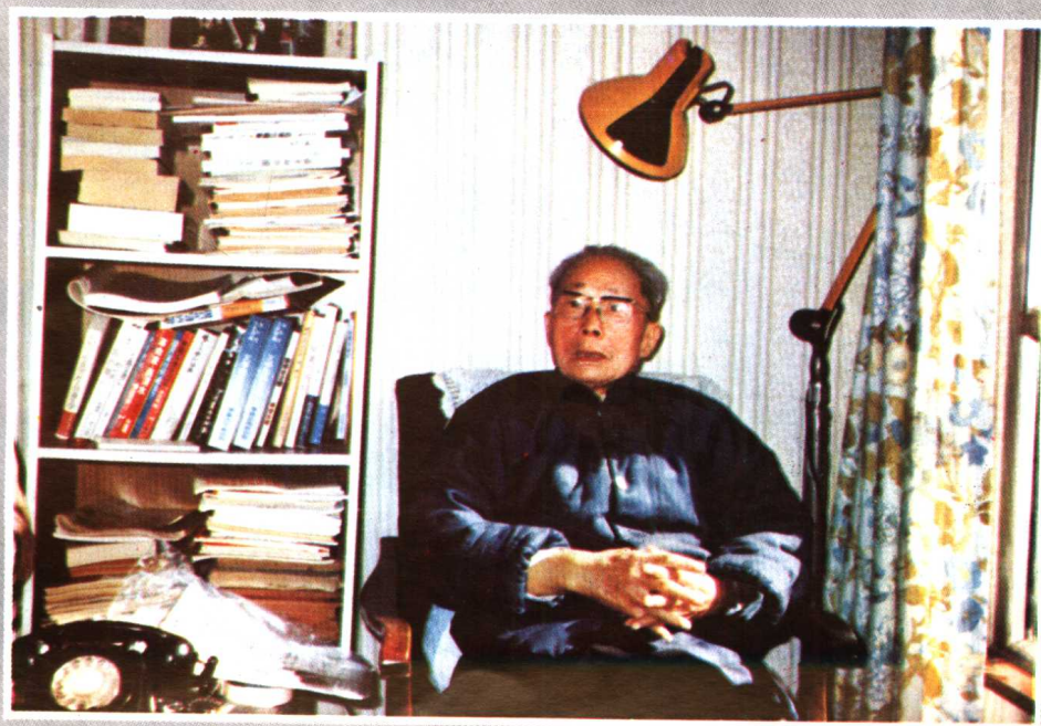
●一九八一年冬攝于九龍寓所之客廳中