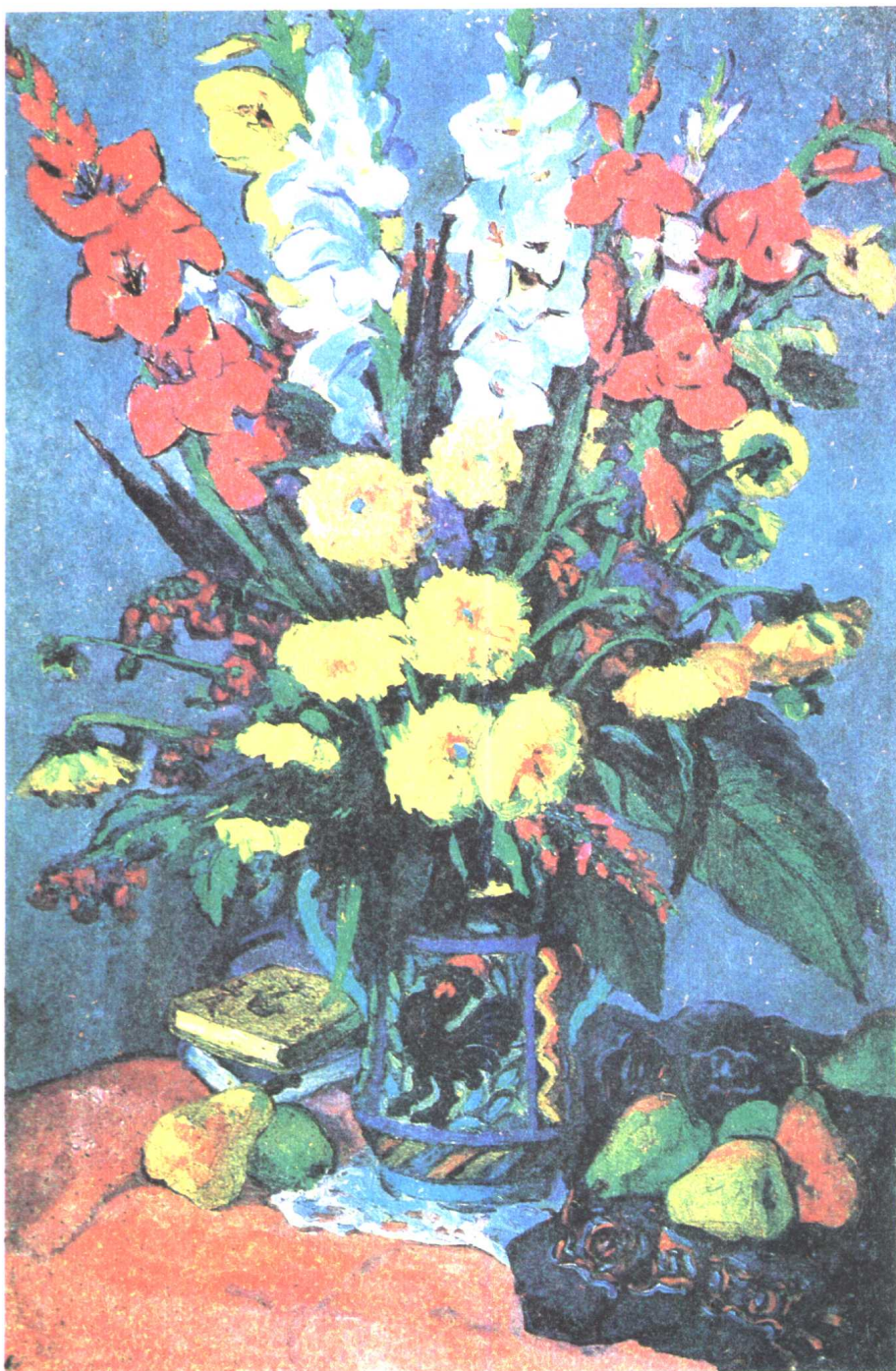
写菊 (1944年) 31 × 59 厘米 油画