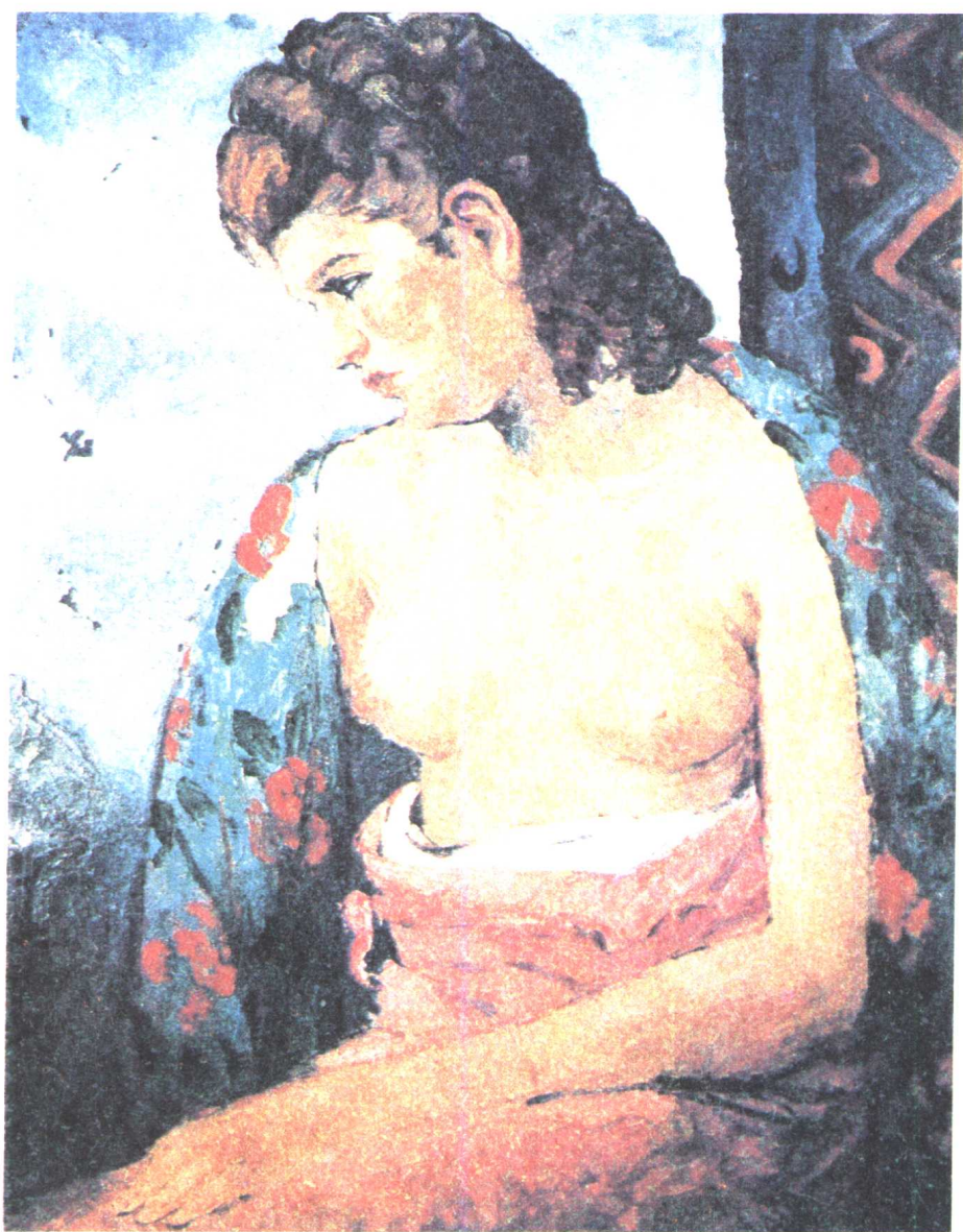
坐着的模特儿 64×49.5厘米 油画