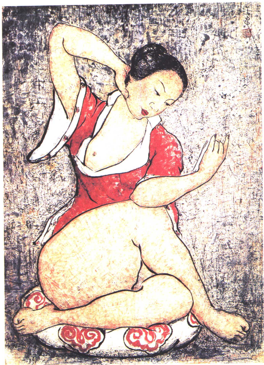
顾影(1954年) 90 × 64.5厘米 国画