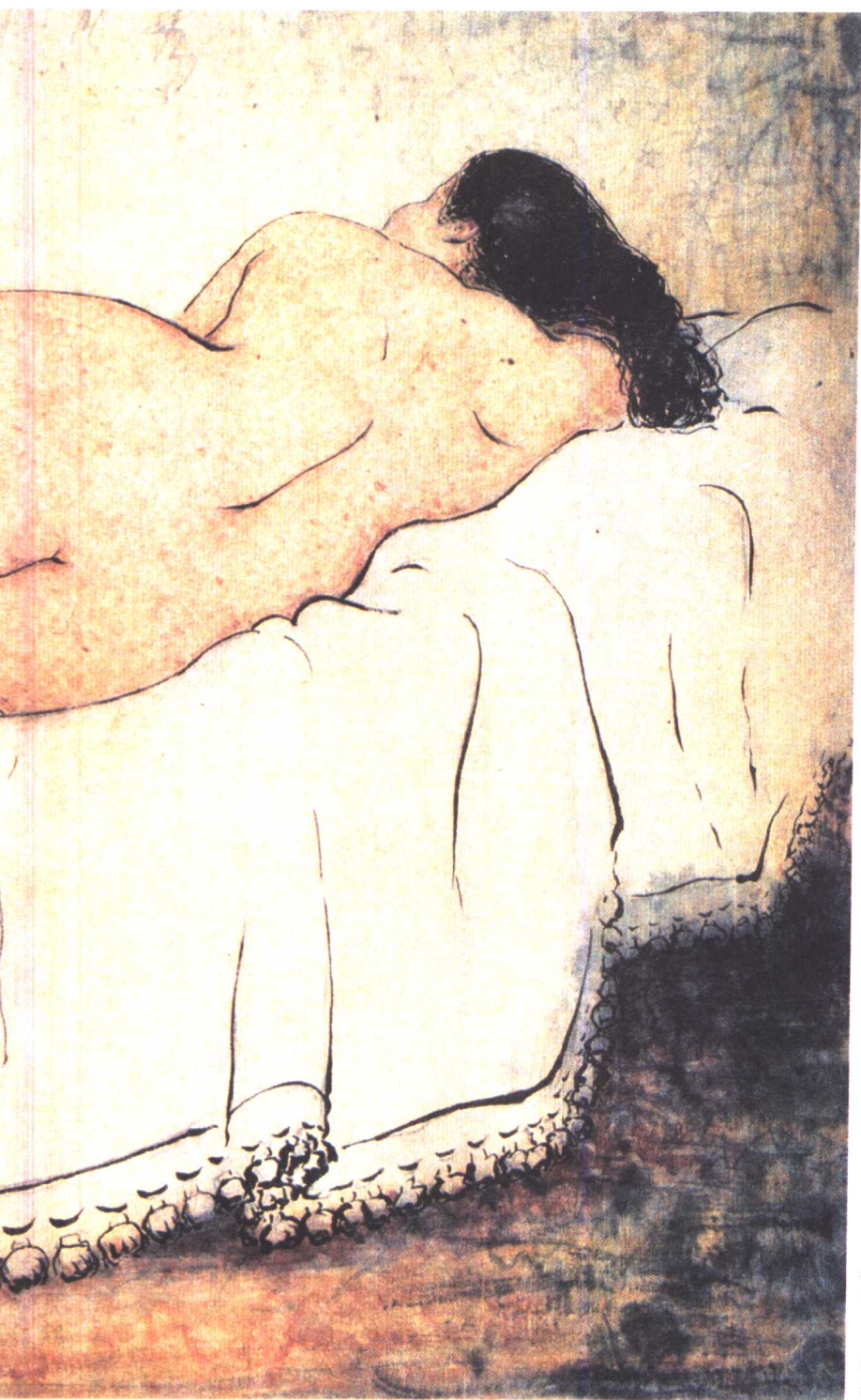
侧卧的女人(1959年) 89.5×89厘米 国画