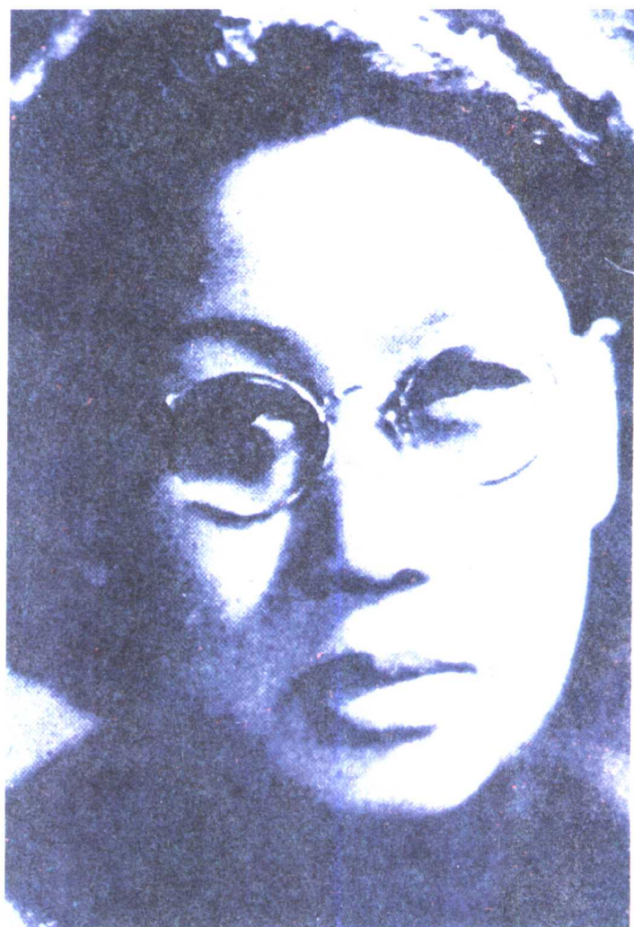
潘玉良 1930年 照片