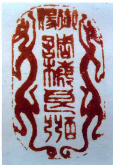
雍正皇帝賜張廷玉調梅良弼印文（桐城市博物館 供稿）