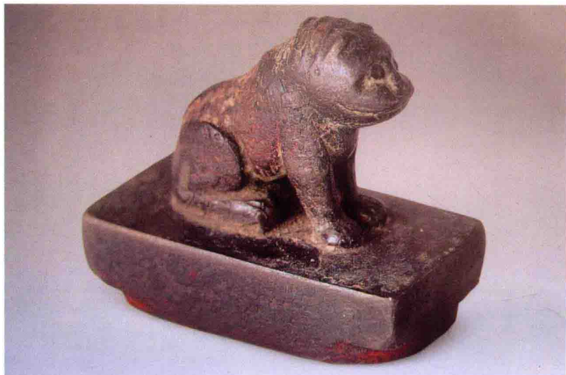
雍正皇帝賜張廷玉調梅良弼印