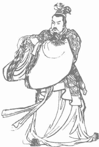
孟尝君食客三千，关键时刻还是靠鸡鸣狗盗之辈，保住了小命