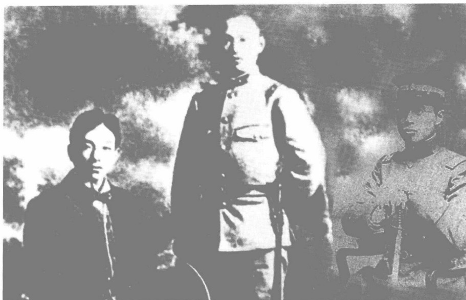
桃园结义影响了无数中国人，其中就包括陈其美、黄郛、蒋介石

黄郛任南京政府外交部长，是应蒋介石之邀，南下来捧义弟的场。可是一个济南惨案，全国民怨沸腾，蒋介石到处拉人顶过，权衡半天，还是决定拿自己的兄长开刀，实施“丢马保车”的办法，亲自发电报逼其下台走人。