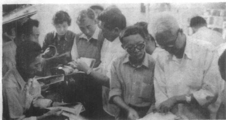
代表们在观摩画报。