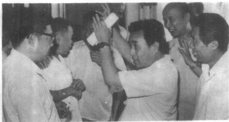
会议期间，代表们经常在一起交谈。