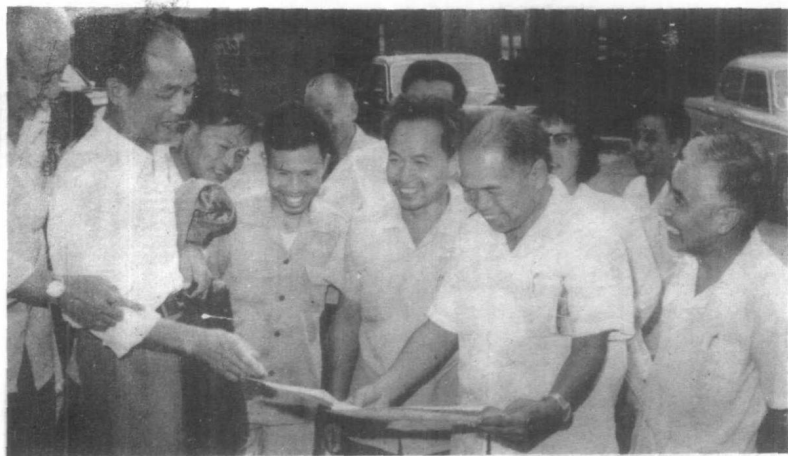
代表们在观看彭真、王任重同志为座谈会的题词。