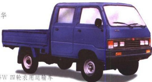
巨力牌 WJ1205W 四轮农用运输车