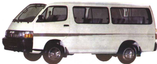
金杯牌 SY6480A 轻型客车

地址：辽宁省沈阳市沈河区万柳塘路40号 邮政编码：110015 电话：(024) 4801718 传真：(024) 4801798 电报：5037