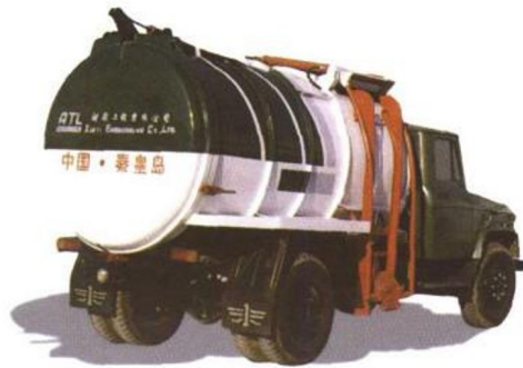
LSS5090XLJ 型自装卸压缩式垃圾车 (侧装)