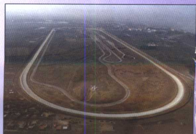
东风汽车公司襄樊试车场