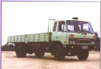
EQ1141G 八吨平头柴油载重车