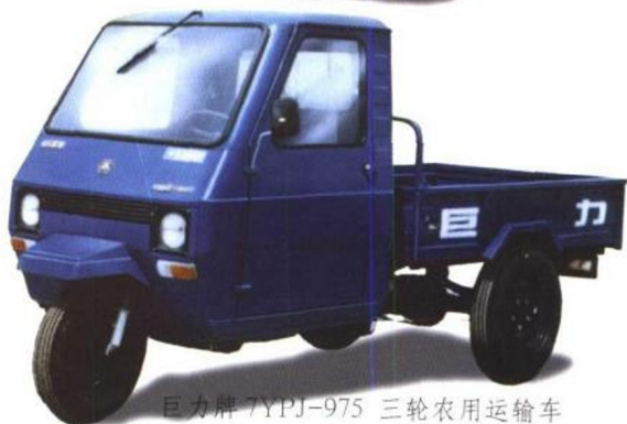
巨力牌 7YPJ-975 三轮农用运输车

本公司是机械部定点生产农用车的骨干企业，职工 2500 人，固定资产 1.5 亿元，是全国工业企业 500 强之一、机械工业百强之一、山东省十大集团之一。