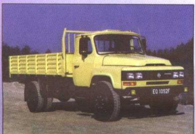
EQ1141G 八吨平头柴油载重车