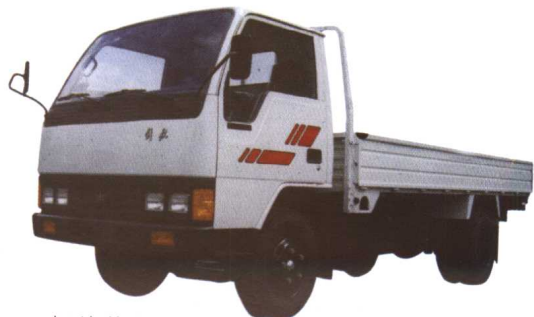
解放牌 CA1043 单排座轻型货车