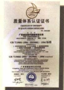
广东质量认证中心 (GACC) 证书 NO. 0496A082