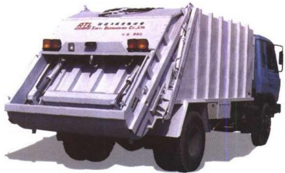
LSS5150ZLJ 型后装压缩式垃圾车

本公司是中国人民解放军第6444工厂与香港联谊工程有限公司合资兴办的企业，总投资350万美元，主要从事城市环卫车辆与机电设备的开发制造。公司成立以来，从澳大利亚GSE公司引进了CAD电脑制图系统及后装压缩式垃圾车生产线，成功地开发了2吨、3吨、5吨、8吨等后装压缩式垃圾车，2吨、5吨侧装垃圾车、拉臂车、吸污车，产品畅销全国20多个省市和地区。公司发挥了军工企业与外资企业的双重优势，卓越地跻身于中国环卫设备设计与制造的先进行列。