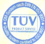
ISO9001 国际质量体系认证标志 NO. Q1961027461001