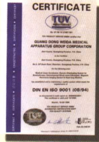
ISO9001 国际质量体系认证证书 NO. Q1961027461001