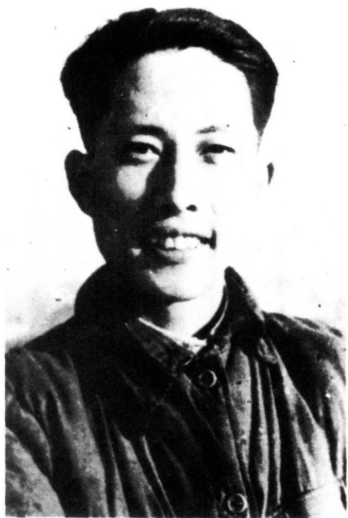
1947年摄于东北 解放区哈尔滨雾虹桥