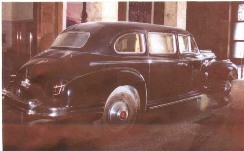
“吉斯”是俄国的御用国车