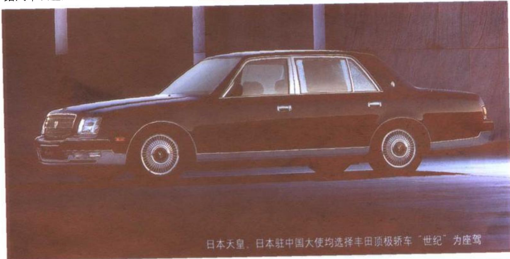
日本天皇，日本驻中国大使均选择丰田顶级轿车“世纪”为座驾