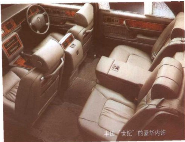
丰田“世纪”的豪华内饰