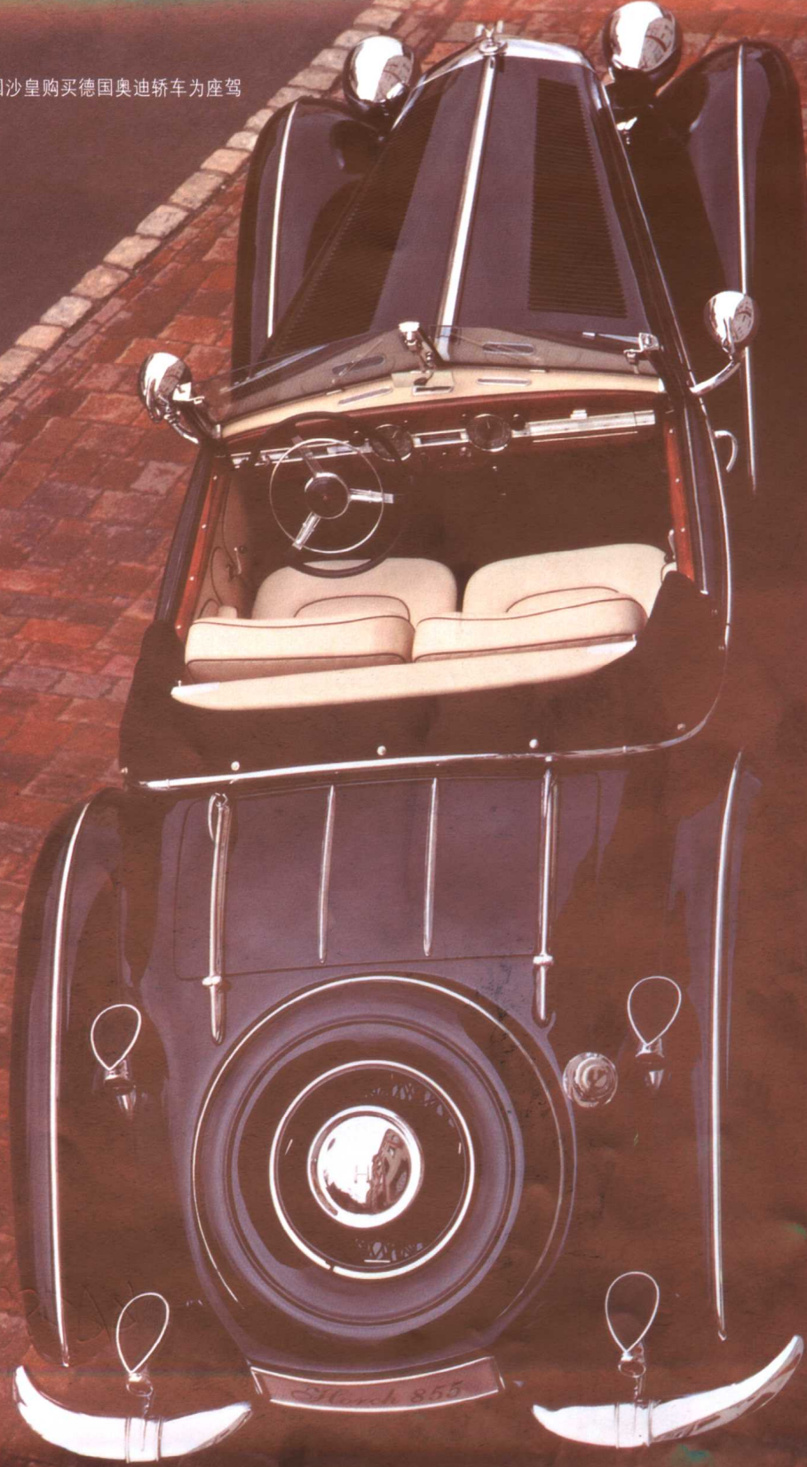
俄国沙皇购买德国奥迪轿车为座驾