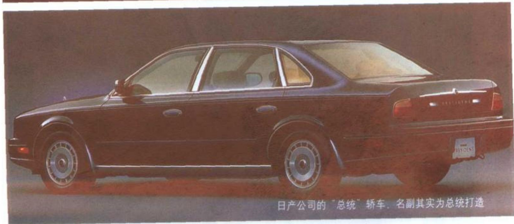
日产公司的“总统”轿车，名副其实为总统打造