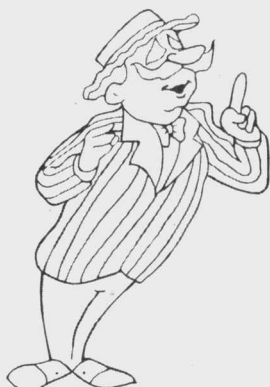
YOU MO KOU CAI