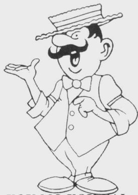
YOU MO KOU CAI