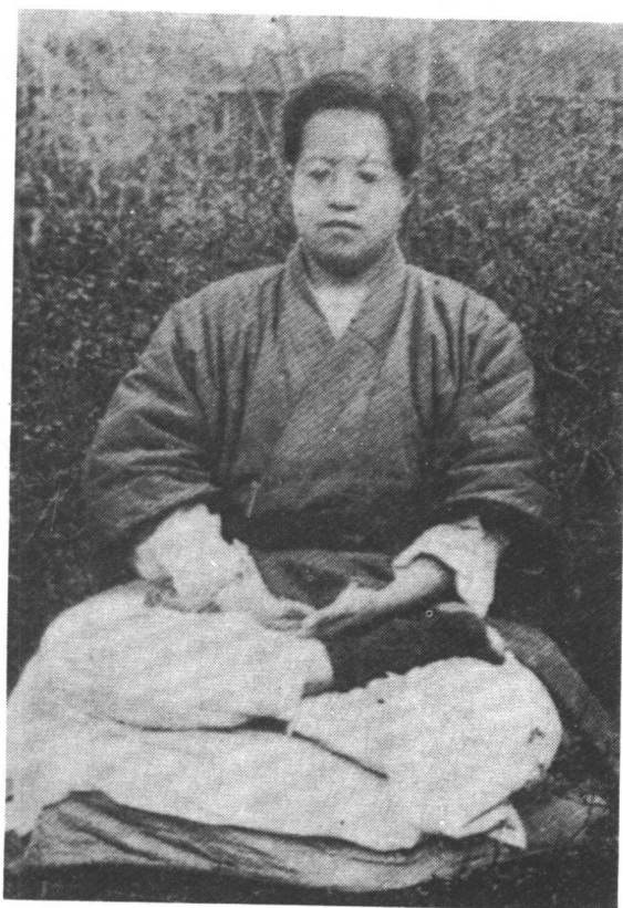
革命元勳章炳麟（太炎）。