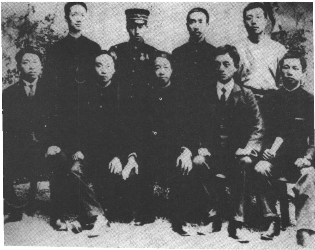
華興會的部分同志。前排左起一黃興、三胡瑛、四宋教仁、五柳楊谷，後排一章士釗、四劉揆一。此外，譚人鳳、陳天華、周震麟、徐佛蘇、張繼、蘇曼殊、吳祿貞等數十人也都是該會會員。