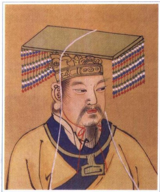
黄 帝（远古） 明人绘

黄帝轩辕氏，三皇之一。本姓公孙，改姬姓，号轩辕氏、有熊氏。少典之子，生于寿丘，建都有熊，是传说中中原各族的共同祖先。黄帝部落原定居西北高原，在向中原地区发展的过程中，与相邻的炎帝部落发生冲突，阪泉（今河北涿鹿东南）之战，炎帝部落被击败，炎黄两部落由此联合。后又与蚩尤的东方九黎族战于涿鹿之阿，击杀蚩尤，从此黄帝成为华夏诸部族联盟的领袖。后世认为养蚕、文字、舟车、历法等创造发明均始于黄帝时期。