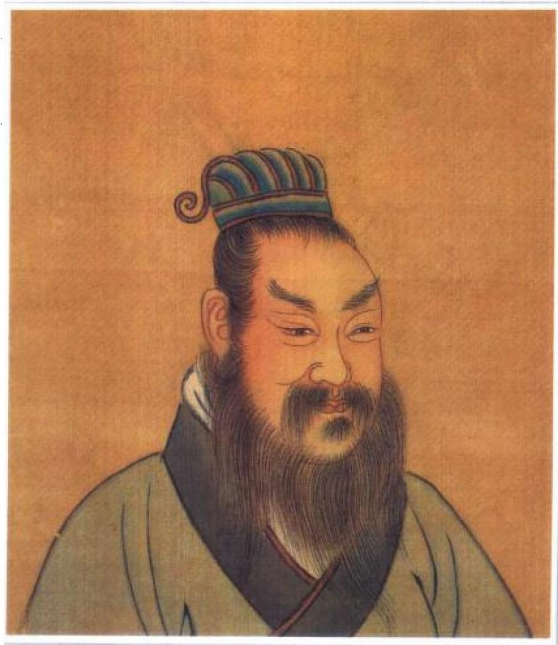
帝 啻（远古） 清人绘

五帝之一。姬姓，号高辛氏。原居于高辛，后作都于亳（今河南登封）。史载：“帝啻高辛者，黄帝之曾孙也。高辛父曰蛭极，蛭极父曰玄器，玄器父曰黄帝。自玄器与蛭极皆不得在位，至高辛即帝位。”颡顛死后，高辛继承他的位置，成为部落联盟首领。