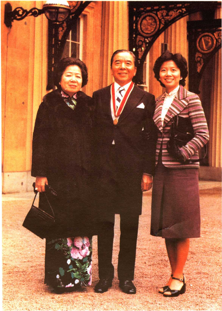
1978年，包玉剛獲爵士勳銜後與夫人及女兒在英國倫敦白金漢宮外合影。