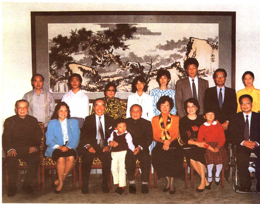
1989年，包玉剛家人與鄧小平家人在北京。