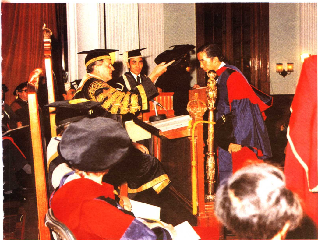
1975年，香港總督麥理浩授予包玉剛香港大學名譽法學學位。