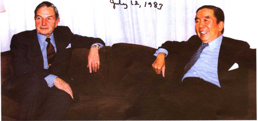
1983年，戴維·洛克菲勒訪問香港，包玉剛在辦公室與他討論世界經濟趨勢。