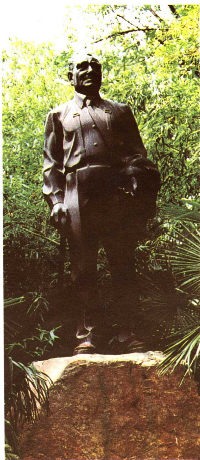
合肥包孝肅公墓園內的包兆龍銅像。