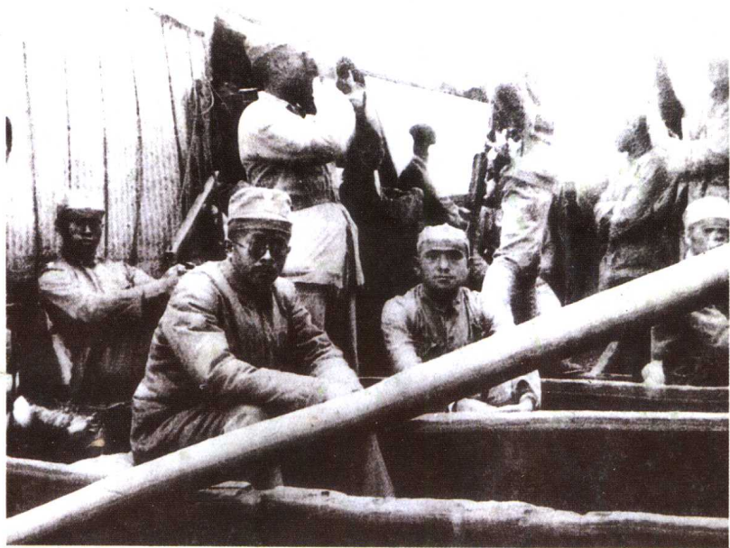
率八路军东渡黄河展开敌后抗日游击战争。 左起：左权、任弼时、朱德、邓小平。