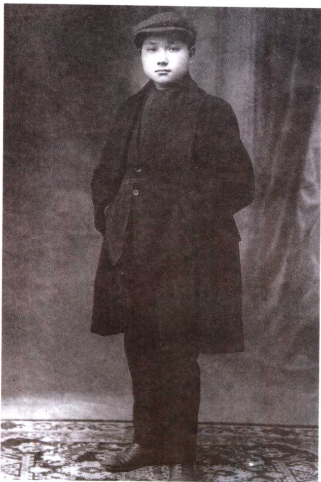
留法勤工俭学时的邓小平。