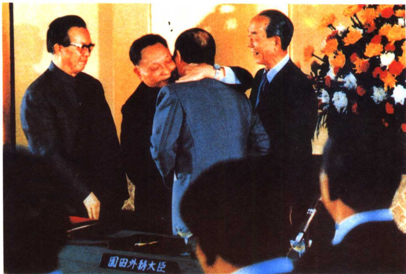
1978年10月,邓小平出访日本,23日互换中日和平友好条约批准书。