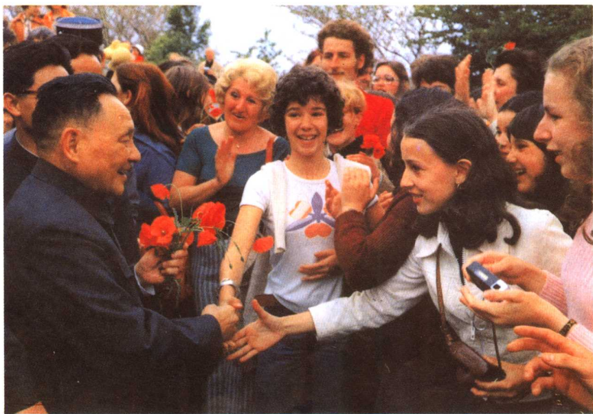
这是 1975 年 5 月邓小平访问法国时,受到法国人民热烈欢迎的场景。