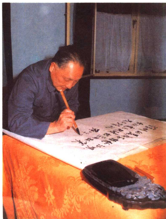
1984年1月，邓小平为深圳经济特区题词：“深圳的发展和经验证明，我们建立经济特区的政策是正确的。”