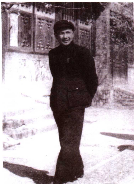
1952年邓小平到中央工作后， 假日里在颐和园散步。