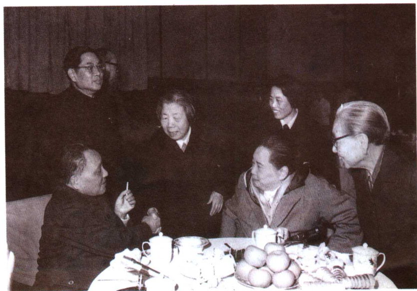
1980年1月1日，邓小平、宋庆龄、邓颖超、罗叔章出席全国政协在政协礼堂举行的新年茶话会。