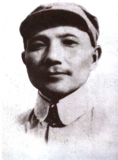
抗日战争初期的邓小平，时年33岁。