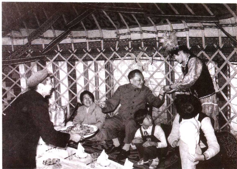
1981年邓小平在新疆哈萨克牧民家里做客。