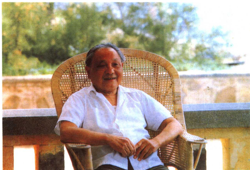
1988年7月,邓小平在北戴河避暑。