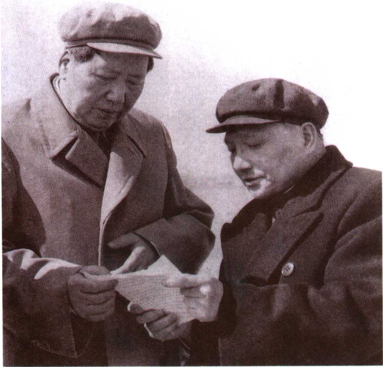
邓小平和毛泽东在一起商讨问题。