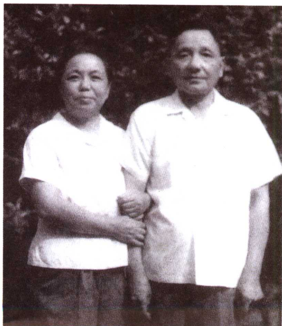
“文化大革命”期间,老俩 口相依为命,互相体贴照料, 用劳动和读书来充实生活。