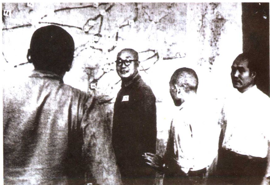
进军西南时,与刘伯承(左二)、李达(右一)、张际春(左一)在作战室。