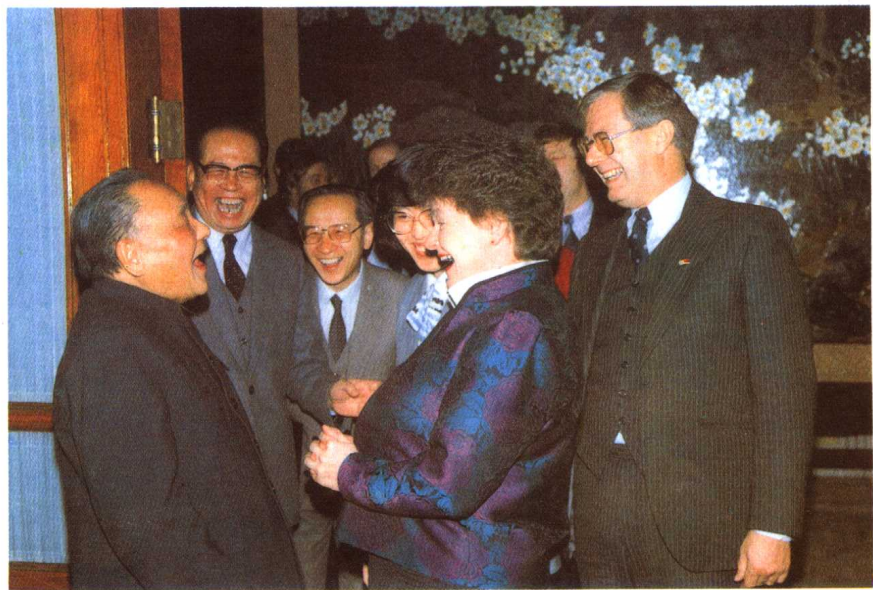
1988年1月20日,邓小平会见挪威首相布伦特兰夫人。