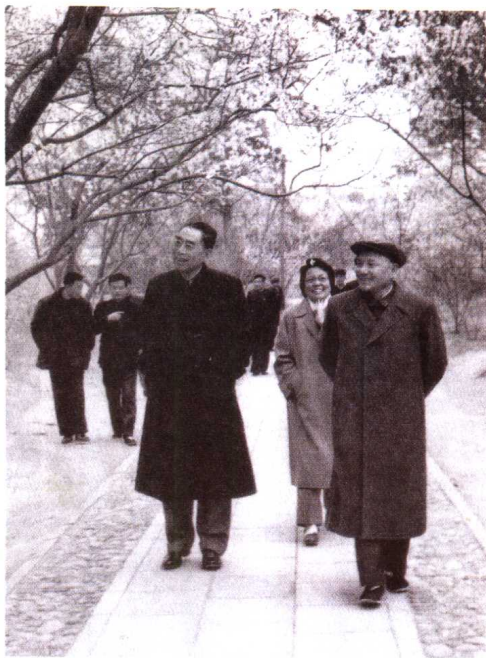
1963年春,邓小平和周恩来 在颐和园后山赏花。