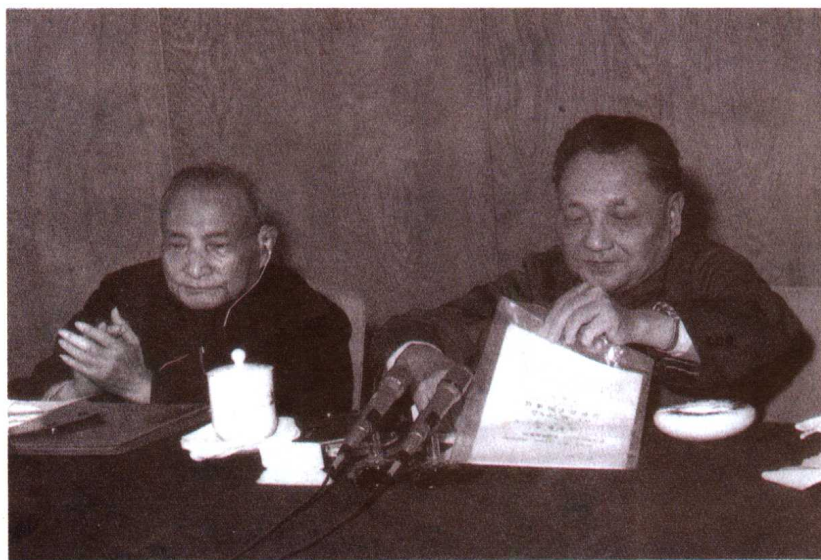
1978年12月召开的中共十一届三中全会,是建国以来党的历史上具有深远意义的伟大转折。邓小平自此成为我党第二代领导集体的核心。图为邓小平和陈云在会议上。