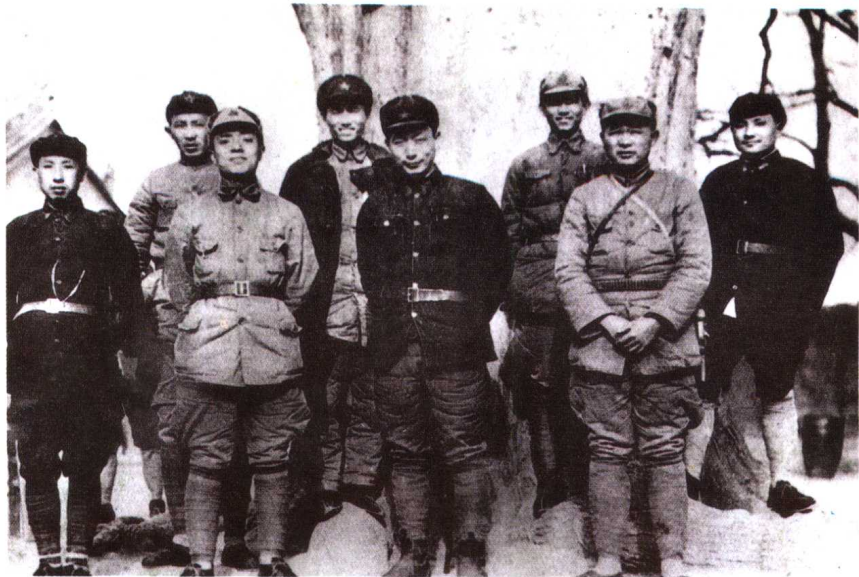
1936年，红军第一军团和十五军团的部分领导干部在陕西淳化县。 右起：邓小平、徐海东、陈光、聂荣臻、程子华、杨尚昆、罗瑞卿、王首道。