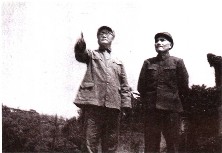
1949年4月,人民解放军第二、三野战军发起渡江战役。刘伯承、邓小平亲临前线,部署作战。