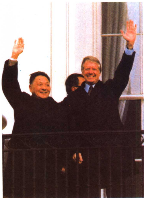
1979年1月底至2月初，邓小平和夫人卓琳出访美国。这是中华人民共和国成立后中国领导人第一次对美国的访问。图为邓小平和美国总统卡特在白宫阳台上。