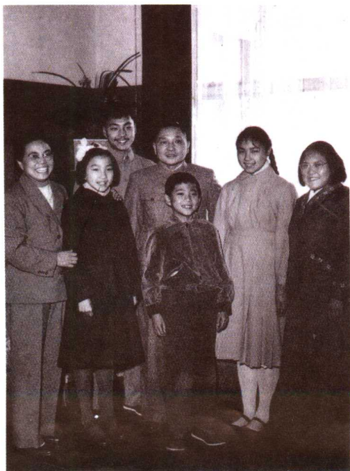
60年代初的全家福。 左起卓琳、邓榕、邓朴方、邓小平、 邓质方、邓楠、邓林。