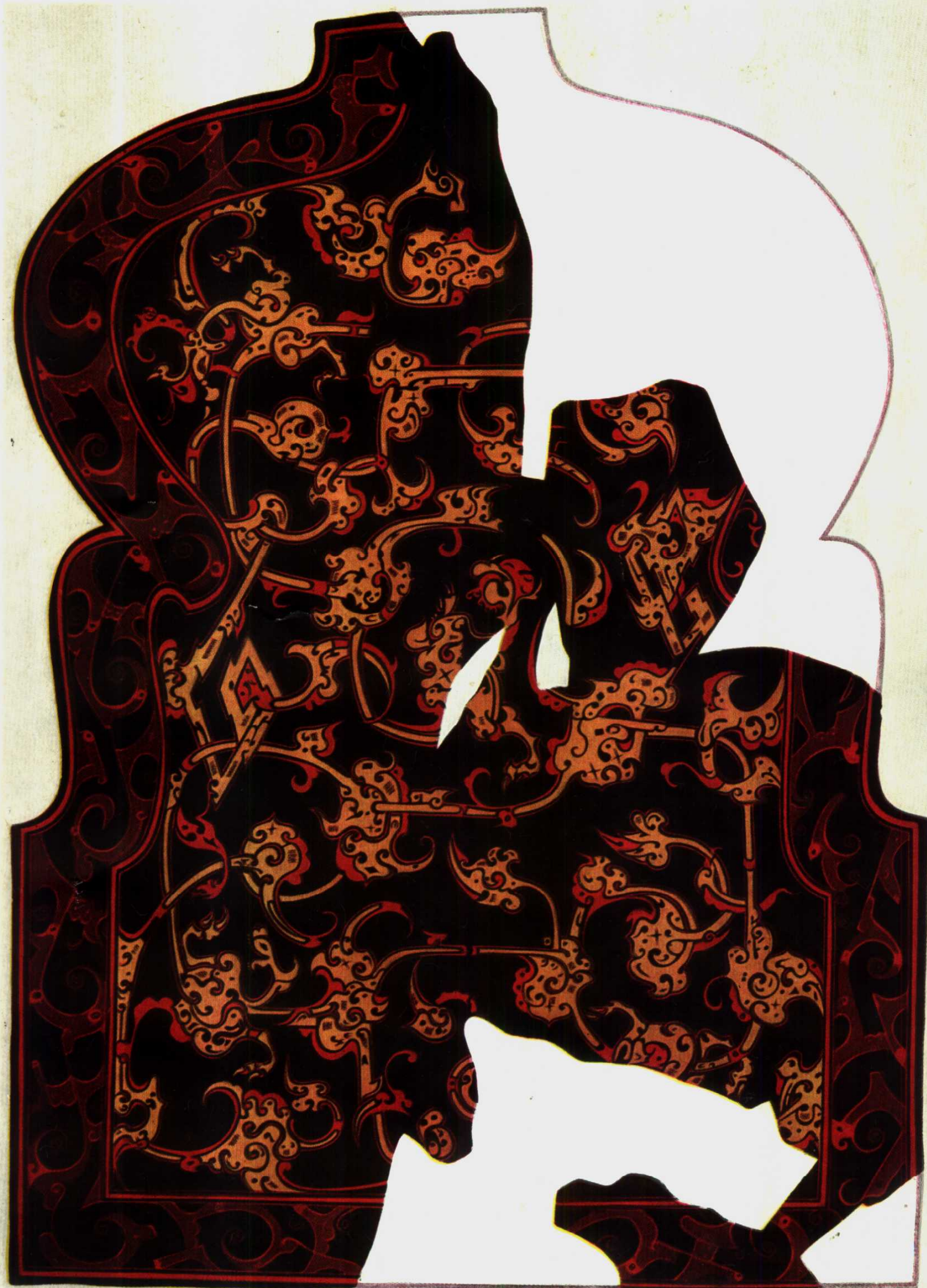
戰國墓(406號)出土漆盾甲, 正面(約 \frac{1}{3} ) (第一次摹本)