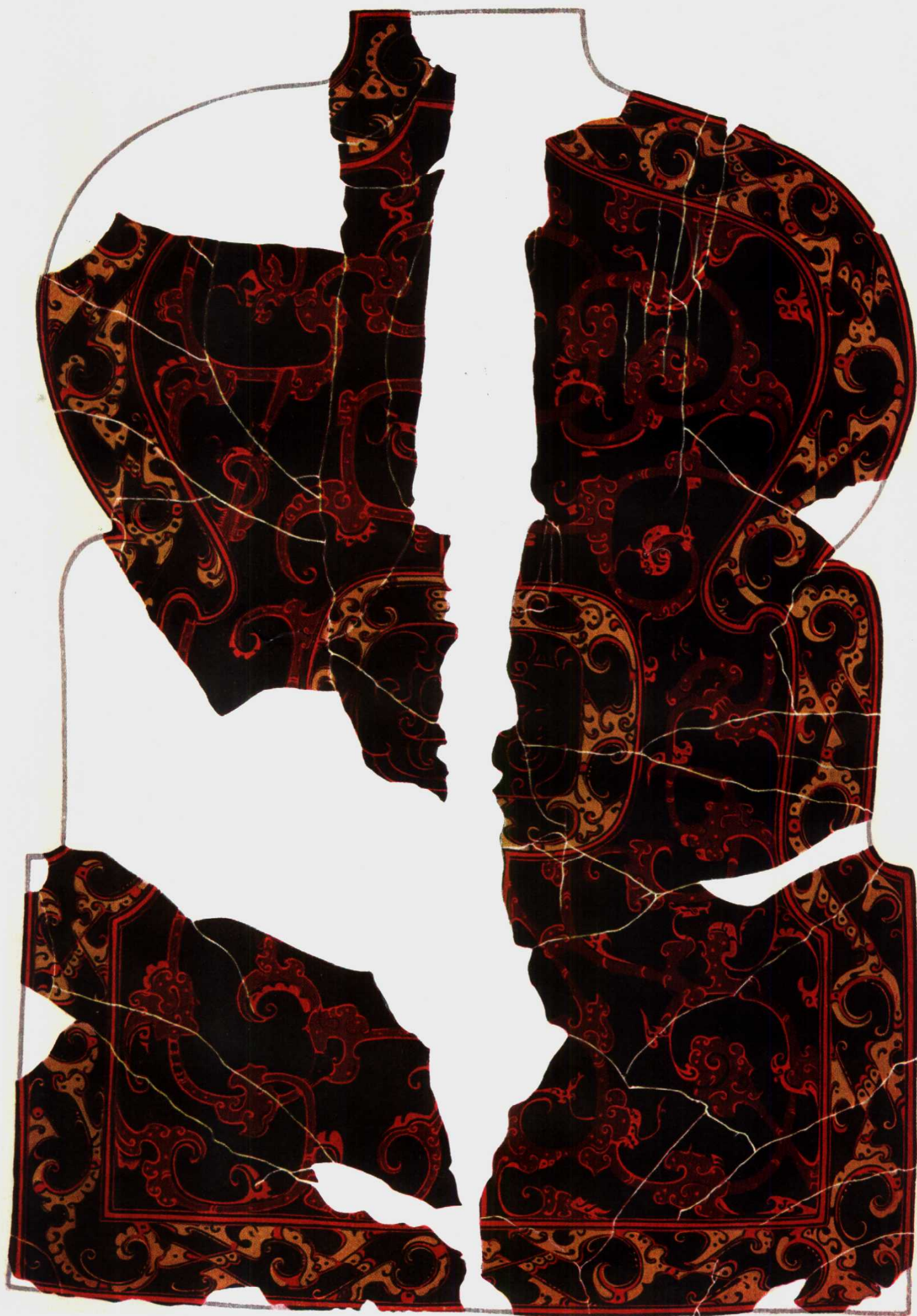
战國墓(406号)出土漆盾乙,背面(約 \frac{1}{3} )