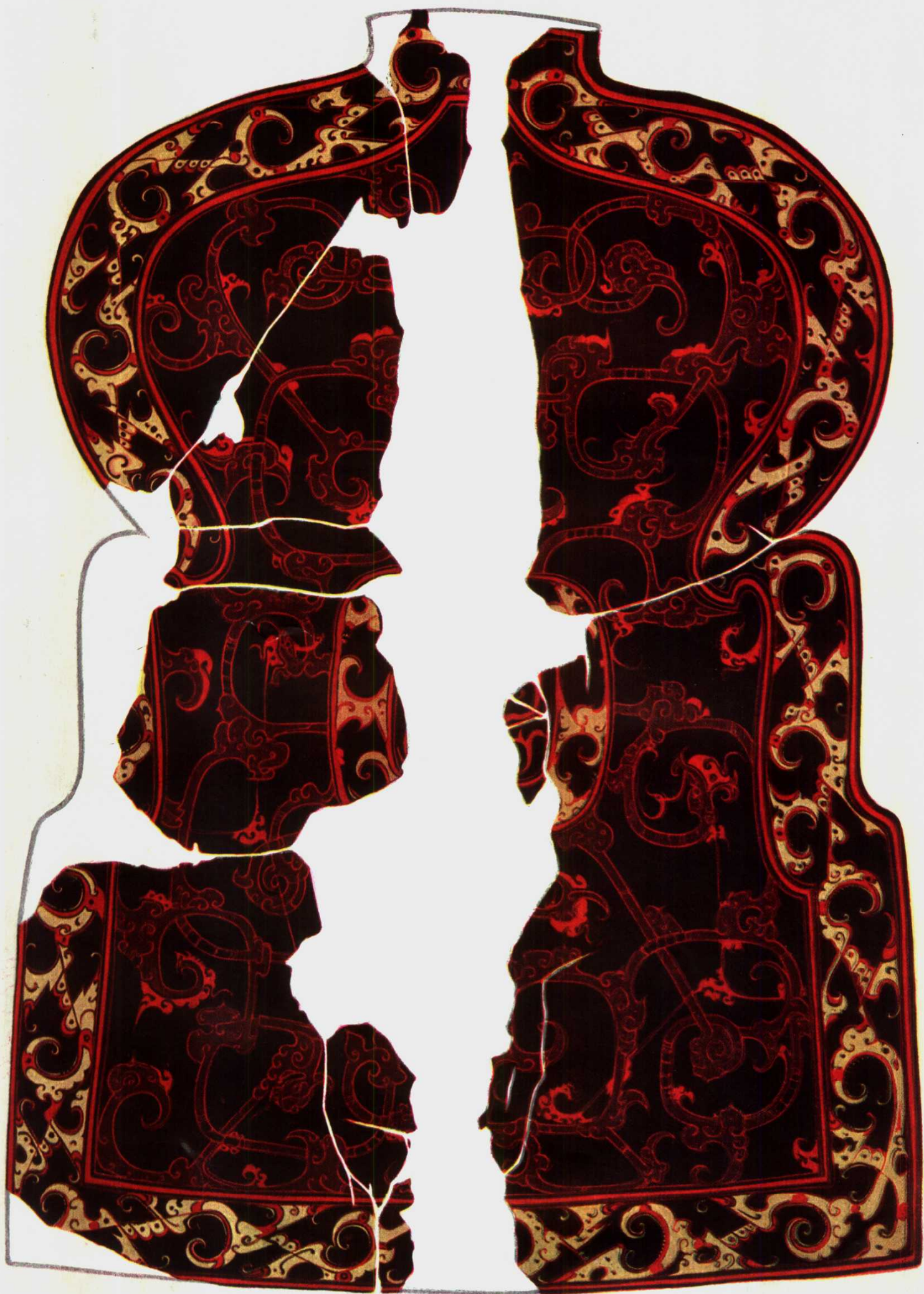
戰國墓(406號)出土漆盾甲,背面(約 \frac{1}{3} )