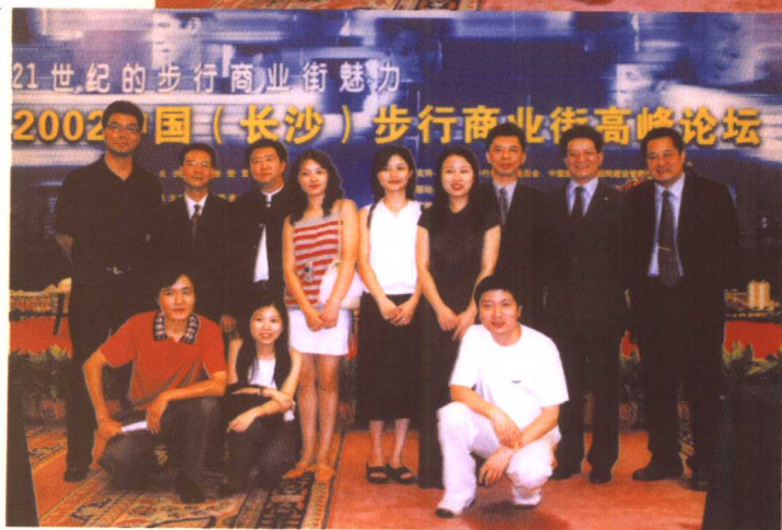
经贸频道策划部工作人员与论坛嘉宾合影