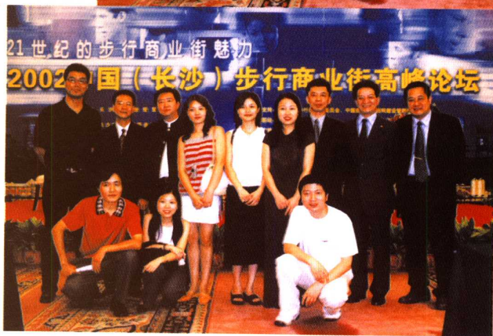
经贸频道策划部工作人员与论坛嘉宾合影