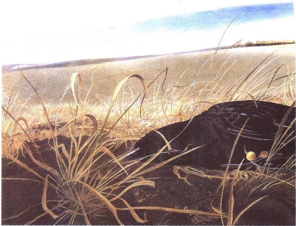
冬天的原野 1942年 蛋彩画 画布 43.8×104.1cm 纽约惠特尼美术馆藏