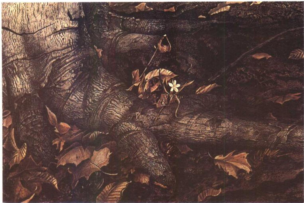
春天之美 1943年 干笔水彩画 画纸 51.2×76.2cm 尼布雷卡—林肯大学歇尔登纪念美术馆藏