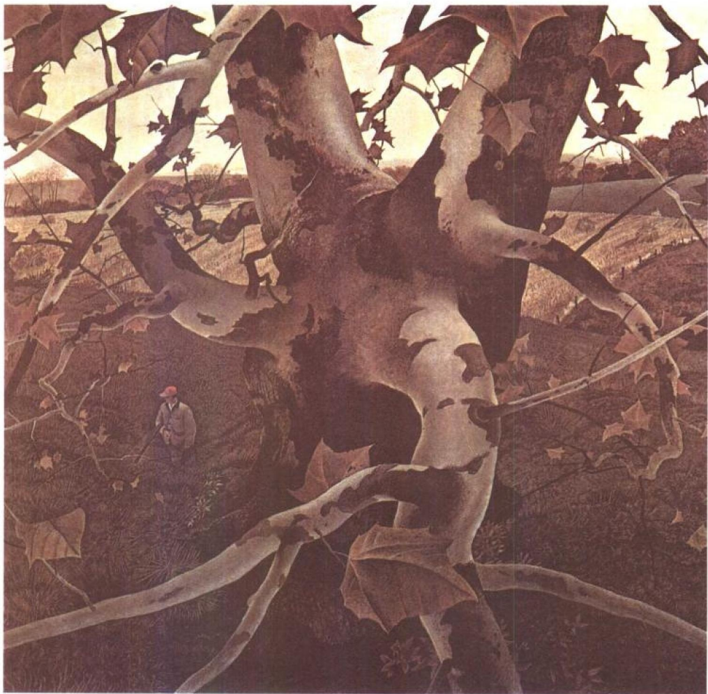
猎人 1943年 蛋彩画 83.8×86.4cm 托乐多美术馆藏

方——宾夕法尼亚州的小村查兹佛德和缅因州的数海哩地区。前者是他的老家，后者是他夏天度假的地方，他从未离开美国，也从未到美国境内其他地方旅行。他绘画的主题，都与他自己的生活有密切关系，画中景物也不会脱离缅因州与宾州查兹佛德村的风土事物。怀斯的这种态度，显示了他的独立自主与自我认识。诚如他在自述中所说的：“我认为一个人艺术的境界与深度是和他对事物的爱恋程度有深厚关系的；我画查兹