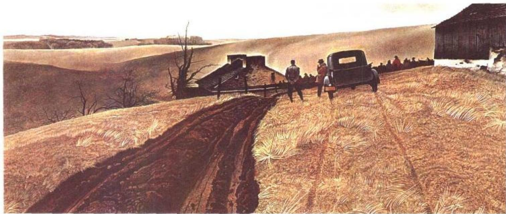
拍卖 1943年 蛋彩画 55.9×121.9cm 私人收藏

(在某一个冬天，怀斯与他的太太及另一位古董商朋友到可尼斯多加牧场拍卖地，牧场的主人是一位高瘦的宾州人，刚丧妻三四个月，他带着怀斯等人去看他要拍卖的房子，牧场主人孤独悲伤的神情，令怀斯印象深刻，于是他回去之后，即画出此作，表达他当天的心情。)