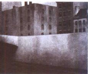
爱德华·霍伯的画作 《前进城市》 1946年 油画 画布 68.6×91.4cm 华盛顿菲利普 收藏馆藏

怀斯被赞誉为美国怀乡写实主义(Nostalgic Realism)绘画大师，他以写实手法描绘他熟悉的乡土景物，将视觉经验加以想像的组织，有浓厚的乡土色彩，创造出独特的怀乡写实作风。我们所说的“美国写实主义”通常是指一般美国传统的写实主义，从德莱塞的《美国的悲剧》为代表的写实主义文学为起点，至温士洛·荷马(Winslow Homer 1836~1910年)、托玛斯·艾肯斯(Thomas Eakins 1844~1916年)、爱德华·霍伯(Edward Hopper 1882~1967年)等名画家的写实主义绘画可以看出，美国文艺的根底潜流着传统的写实主义精神。这种精神直到今日仍然根深蒂固。