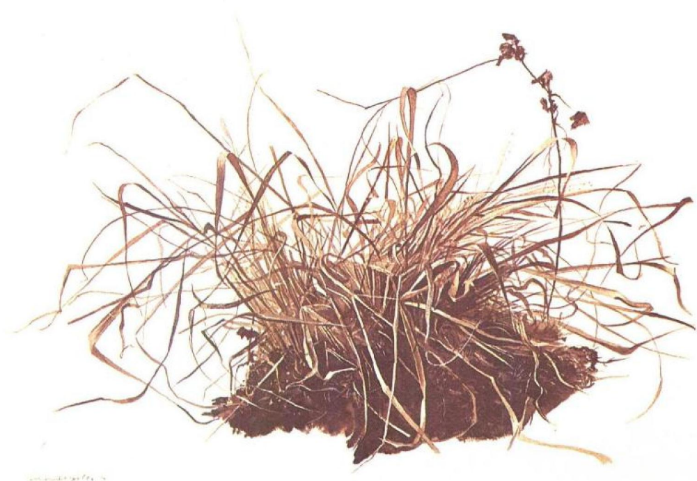
草叶(为《冬天的原野》所画) 1941年 干笔画 43.2×54.6cm 玛格丽特·亨帝藏

较过去复杂多歧，有手描的写实作品，有应用实物的普普艺术作品，也有应用摄影技术的超写实主义，从具体的物象追求写实主义的精神，因为其创作观念与过去截然不同，所以被称为新写实主义。50年代与60年代的美国现代美术，几乎是抽象绘画的天下，抽象表现主义与几何学抽象画风靡一时。不过为时不久，新写实主义、普普艺术等相继兴起。到了70年代美国的传统写实主义重新复活，反映了美国艺术的本质。