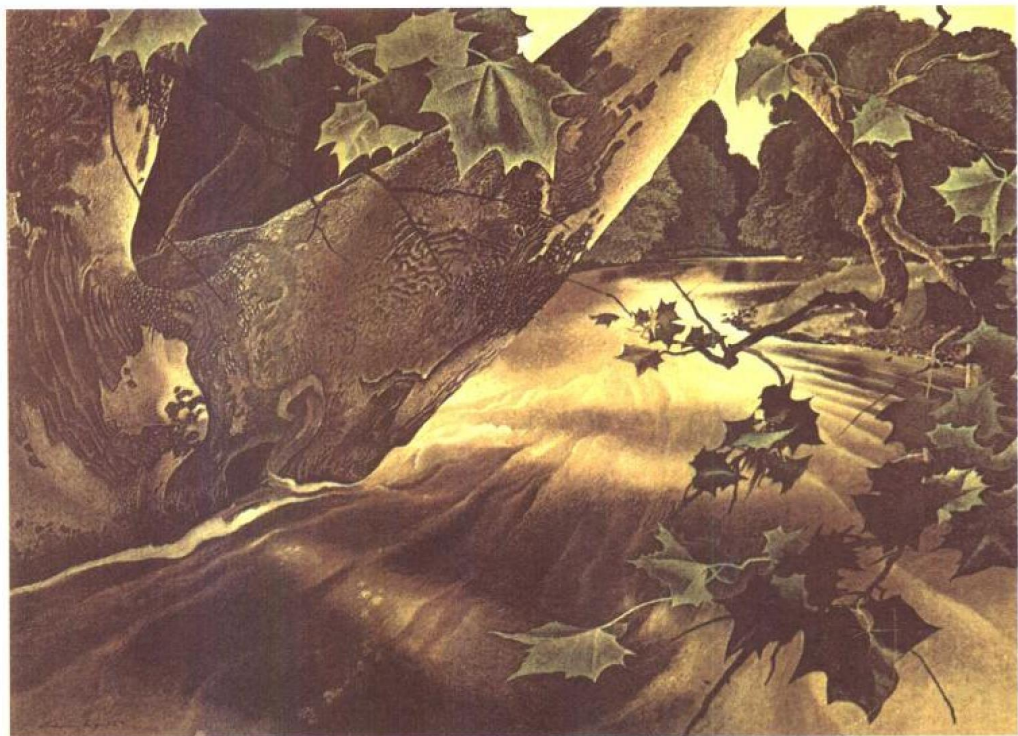
春日融雪的洪流 1942年 蛋彩画 78.7×55.9cm 小保罗·寇得门·卡波收藏

美术馆争相收藏，在纽约现代美术馆、得扬美术馆、威明顿戴拉维尔美术馆、费城美术馆、夏威夷艺术中心、安杜夫美术馆、水牛城的奥布莱特·诺克士美术馆等都藏有他的杰作。1970年波士顿美术馆开馆一百周年纪念展，特地筹划举办规模盛大的怀斯大回顾展，作品包括蛋彩画、水彩画及铅笔素描等多达两百幅，盛况空前。怀斯的受人注目，不仅限于美国境内，同时也逐渐引起外国艺术界的重视。1974年日本东京国立近代美术馆也大规模举办怀斯回顾展。在美术市场上，怀斯是美国现仍在世的画家中，画价卖得最高的画家。他在美国艺术界占据一个非常特殊的地位。