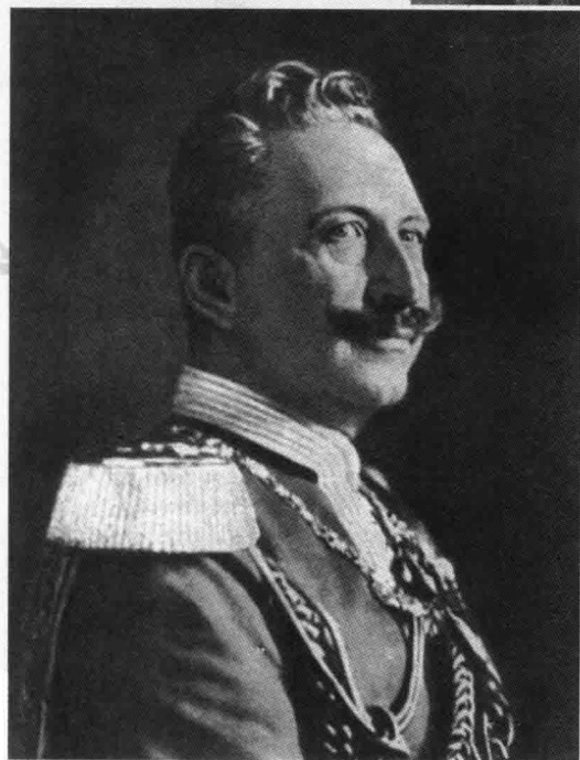
德国皇帝威廉二世