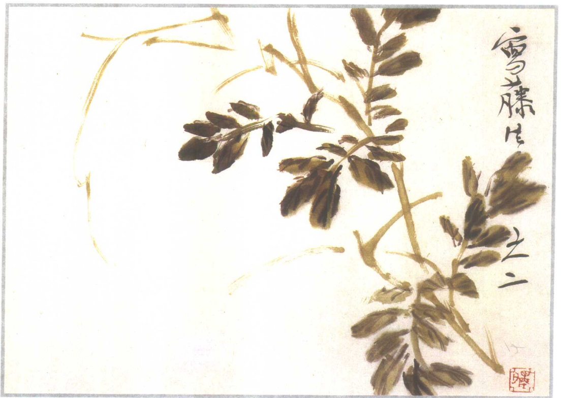
藤蔓枝分四面，布叶应有空间观念。