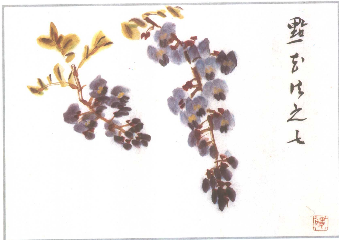
整理收拾花穗，使隐显有层次之感。（或在花冠上，浅淡地点染石膏。）