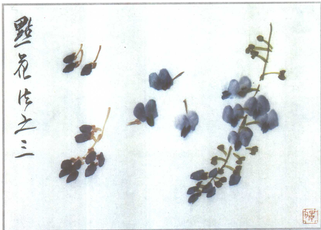
加点花冠小瓣，并藉以定花冠向背。