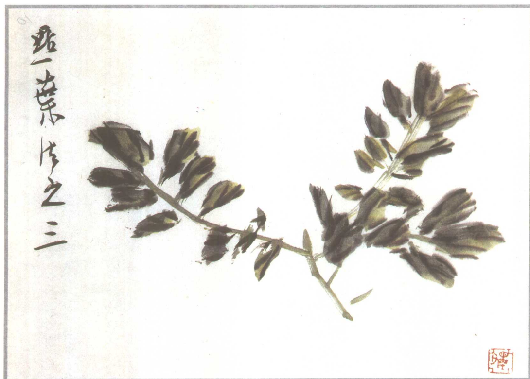
三柄叶，即需加以组织，有掩映。