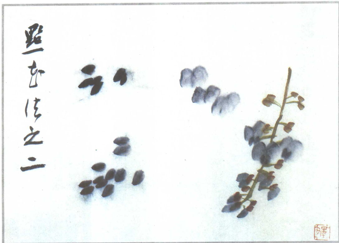
花苞色彩浓重，花冠大瓣浅淡，小瓣浓重。