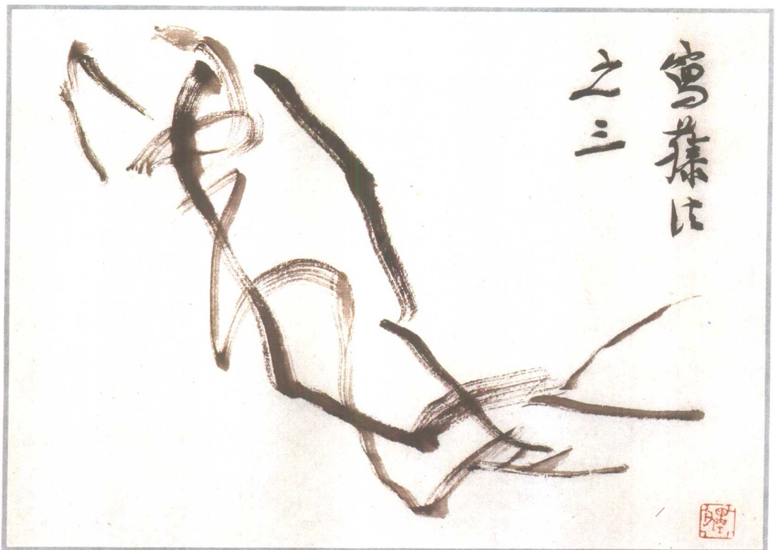
用墨有浓、淡、枯、润，以增强空间氛围。