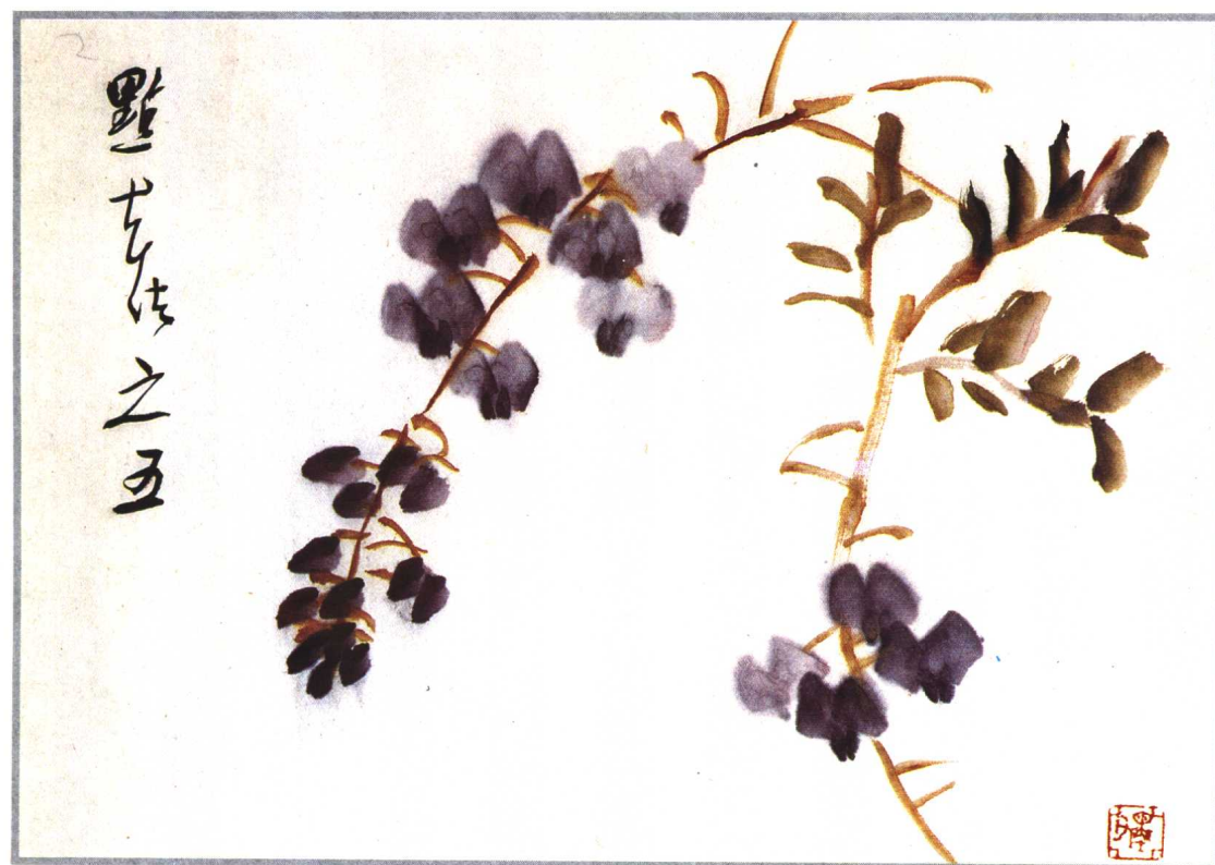
穿花梗，点嫩叶三四柄。