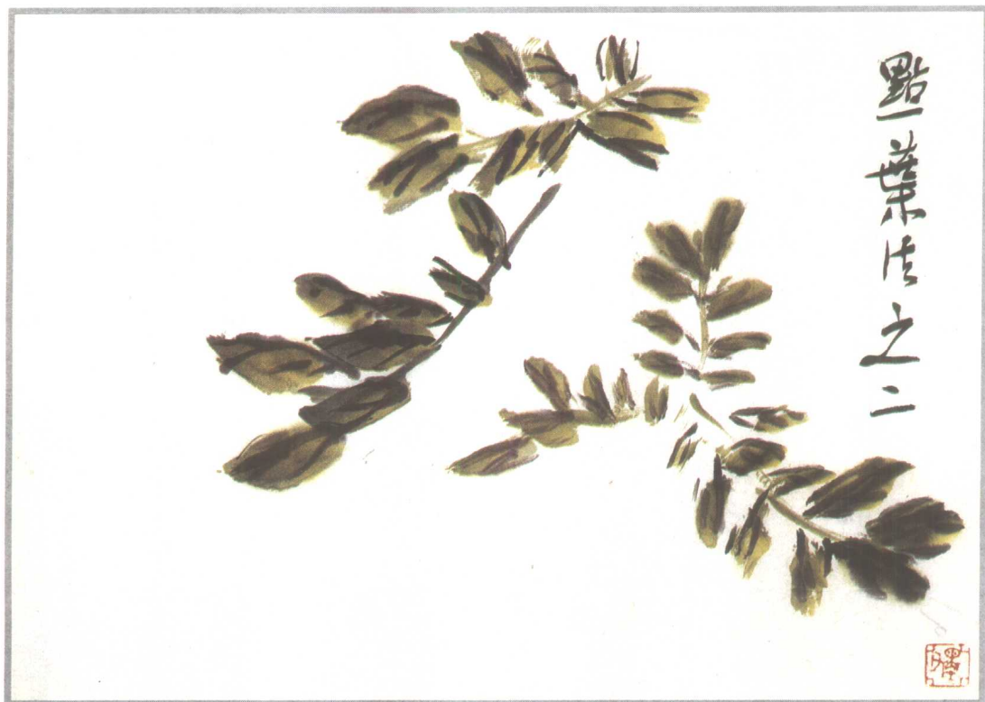
点叶需知反正，有姿态。