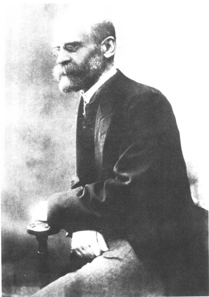
爱弥尔·涂尔干 (Emile Durkheim, 1858-1917)