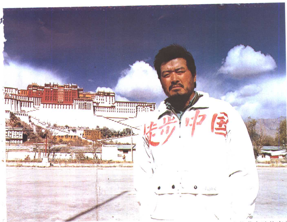
在拉萨布达拉宫前