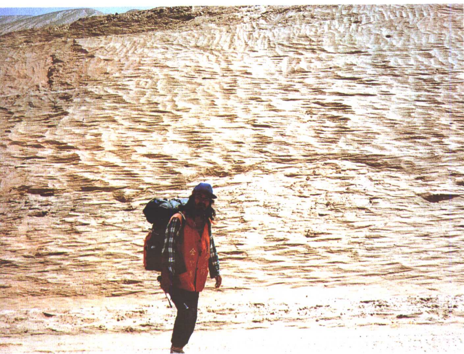
在滇藏路最后一座高山——红拉山下