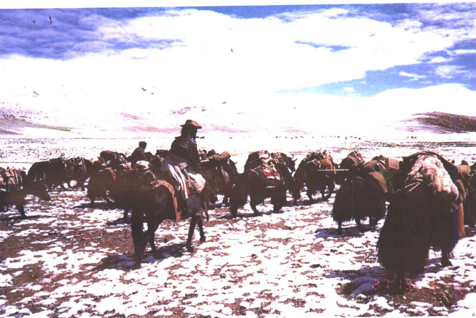
与牦牛队一起穿越阿里无人区