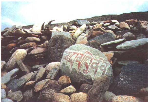
在西藏随处可见的玛尼堆上的石刻及牛、羊角