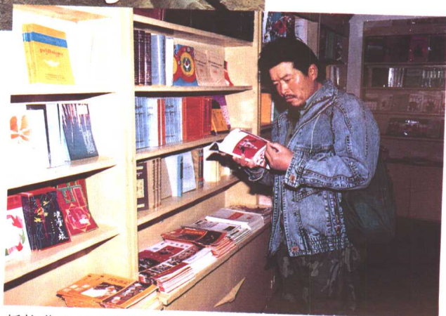
抵拉萨查阅西藏资料