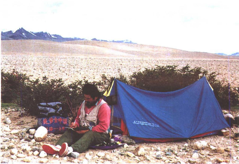
露宿前抓紧时间记当天日记