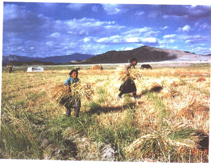
阿里地区的藏民在收获青稞