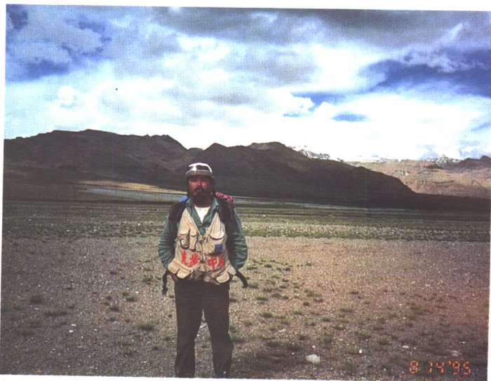
在阿里岗仁波钦“神山”前(右后侧为“神山”山顶)