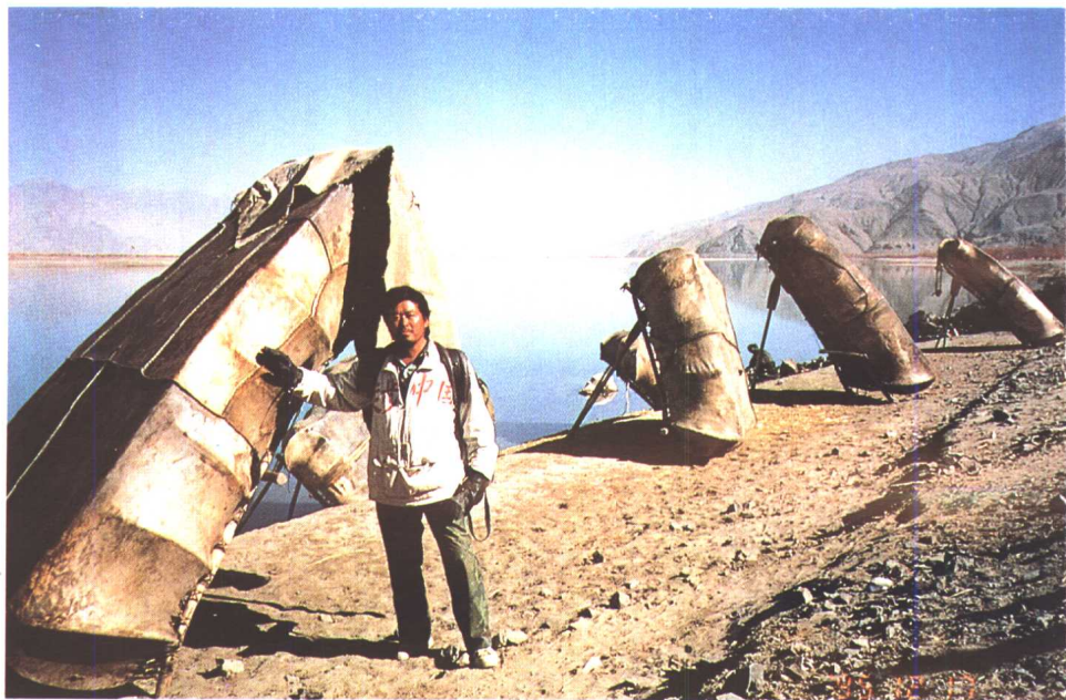
雅鲁藏布江边渡人之“牛皮筏”