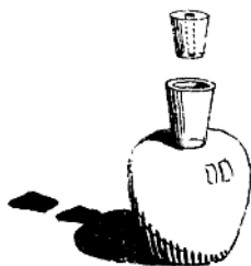
圖 1 比重測定瓶

一，因為水面會有點凸出盆子的邊緣，所以要斷言甚麼時候水是剛滿到邊緣，是一個很困難的問題。其次是會有不少的溢水粘附在容器的側面。第一個缺點可以由縮小水面的面積而減少。用如圖 1 所示的瓶子可以將此缺點減少至最小程度。這瓶子的口上有一隻與瓶口配合很密的毛玻璃瓶塞，瓶塞中央