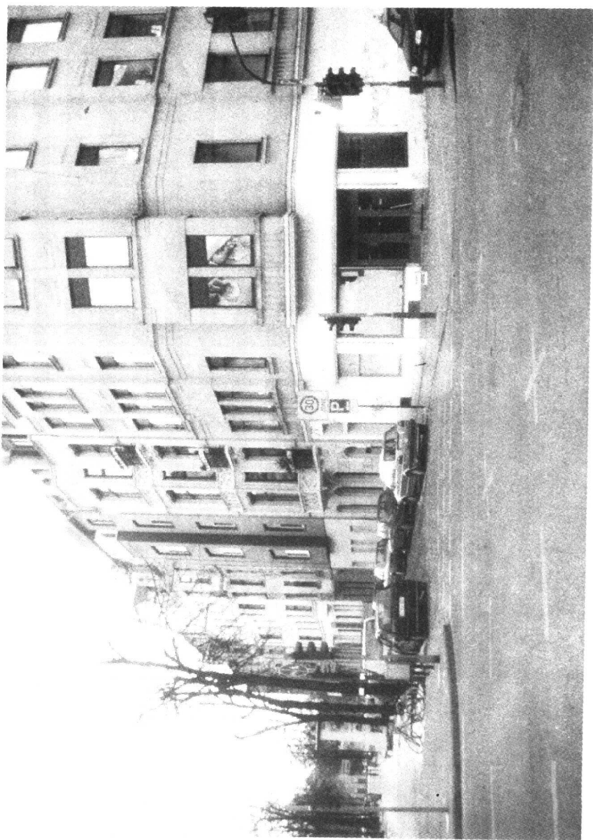
海因里希·伯尔出生地——科隆 托伊托堡街 28 号 2 层楼 (1 街)

1917 Teutoburger Str. 28, 1. Etage, Köln