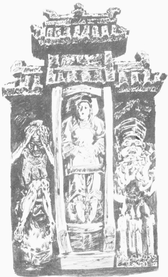
凤凰 叶武林 绘