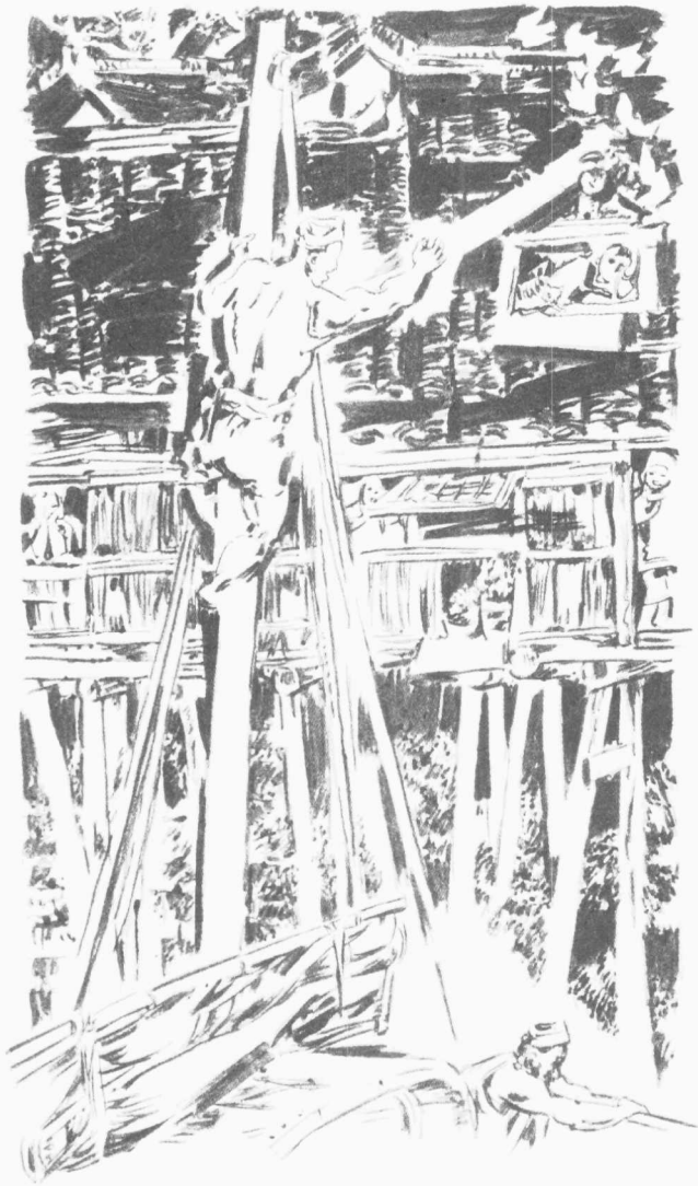
白河流域的几个码头 叶武林 绘