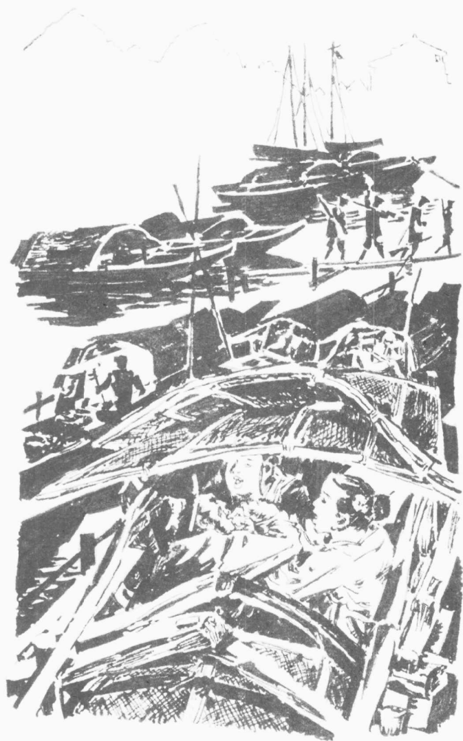
一个多情水手与一个多情妇人 叶武林 绘