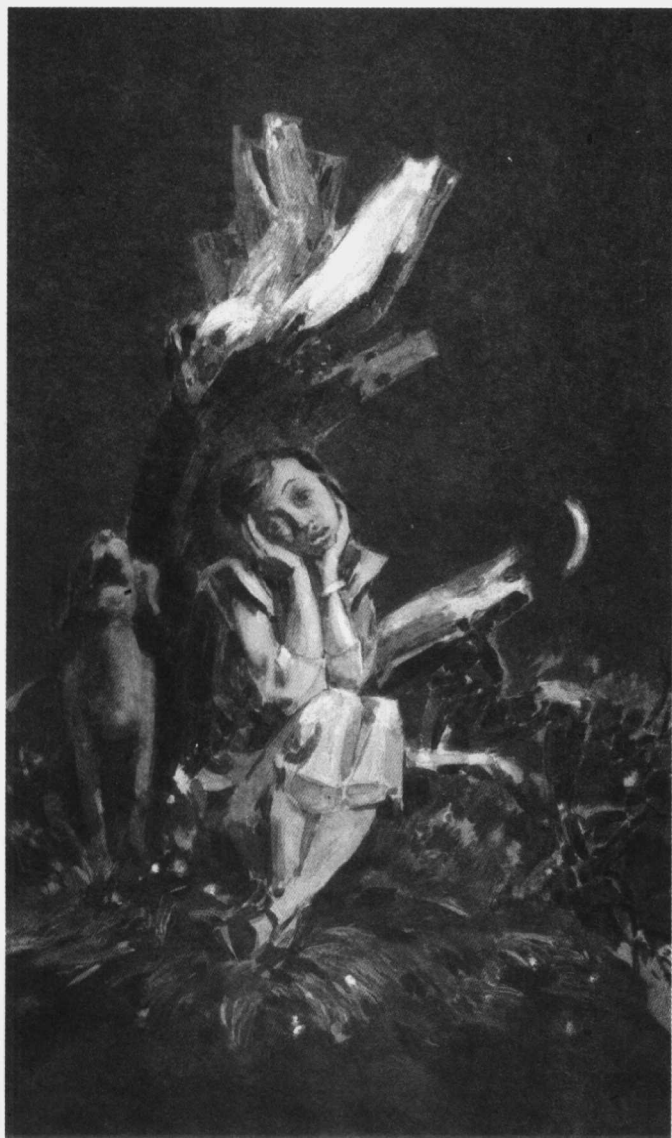
边城 叶武林 绘