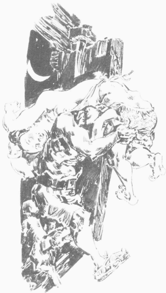
鸭窠围的夜 叶武林 绘