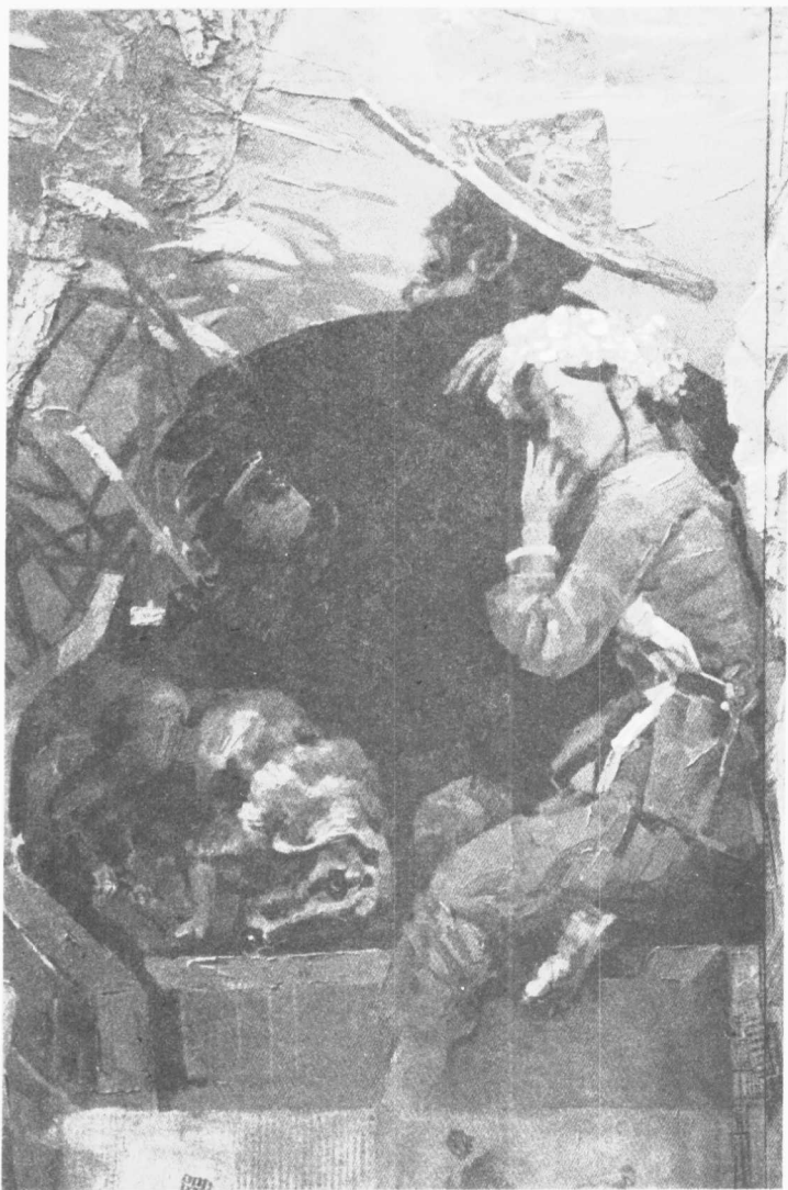
中国现代文学馆壁画《受难者》局部