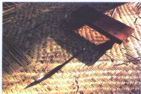
橇子 / 铁制的 编织蓆席用的 工具。