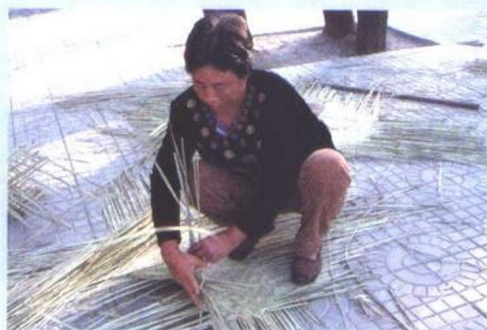
将蓆眉子用水 润过、用石碾 过后，按长短 选出长蓆、二 蓆、三蓆，分别 用来编织蓆席 的不同部位。