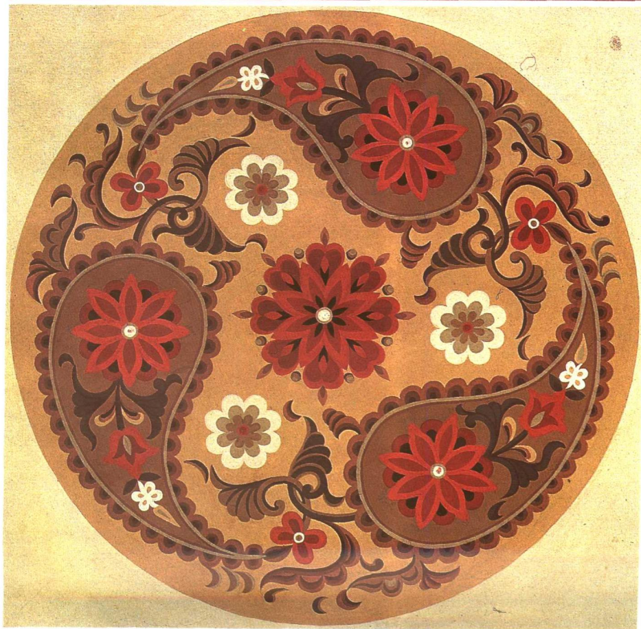
巴旦姆纹栽绒座垫 焉耆县