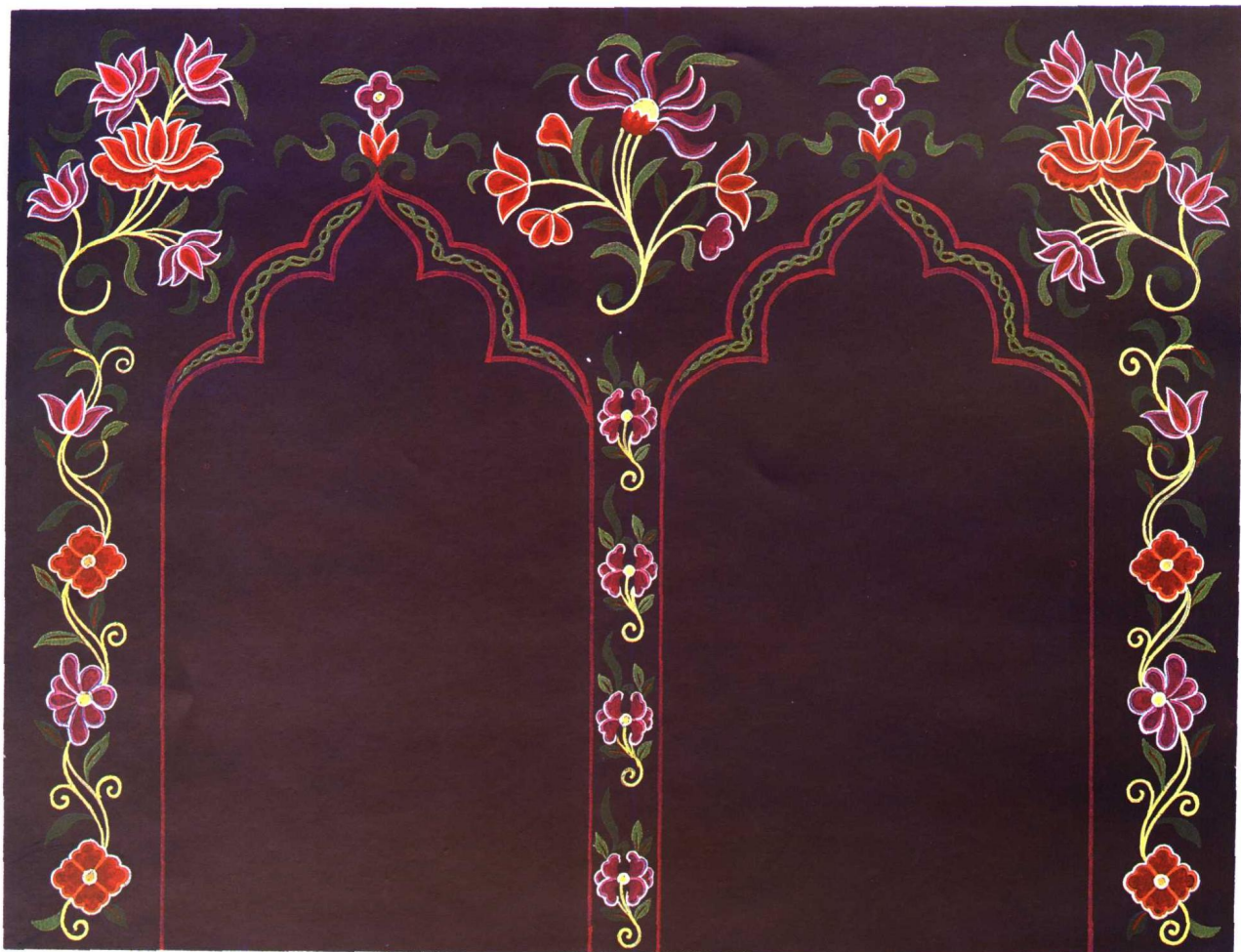
套针绣礼单 鄯善县