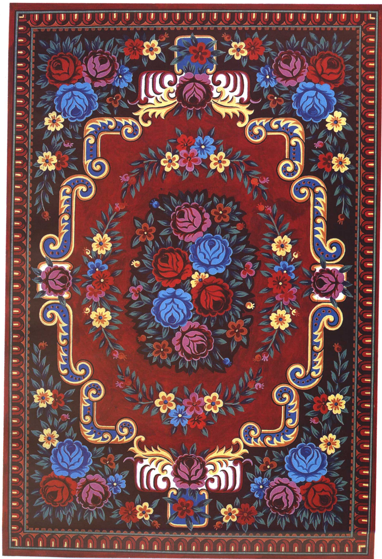
栽绒美术地毯(艾地亚勒) 莎车县