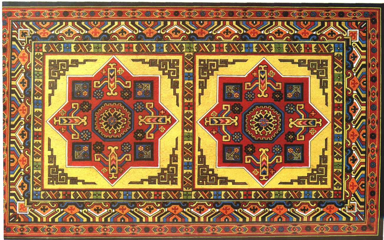
栽绒八角花地毯 焉耆县