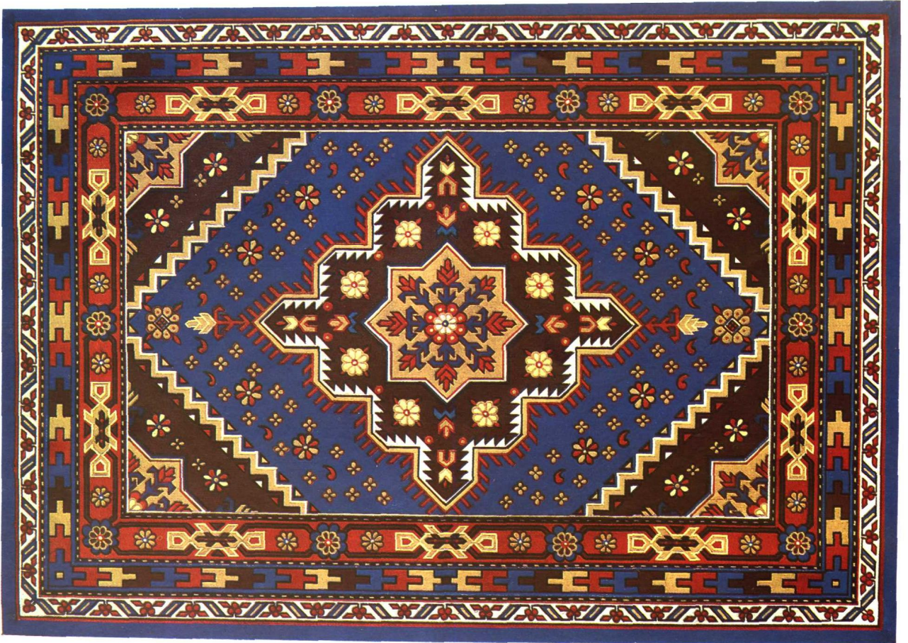
栽绒水波浪花式地毯(开力肯) 洛浦县