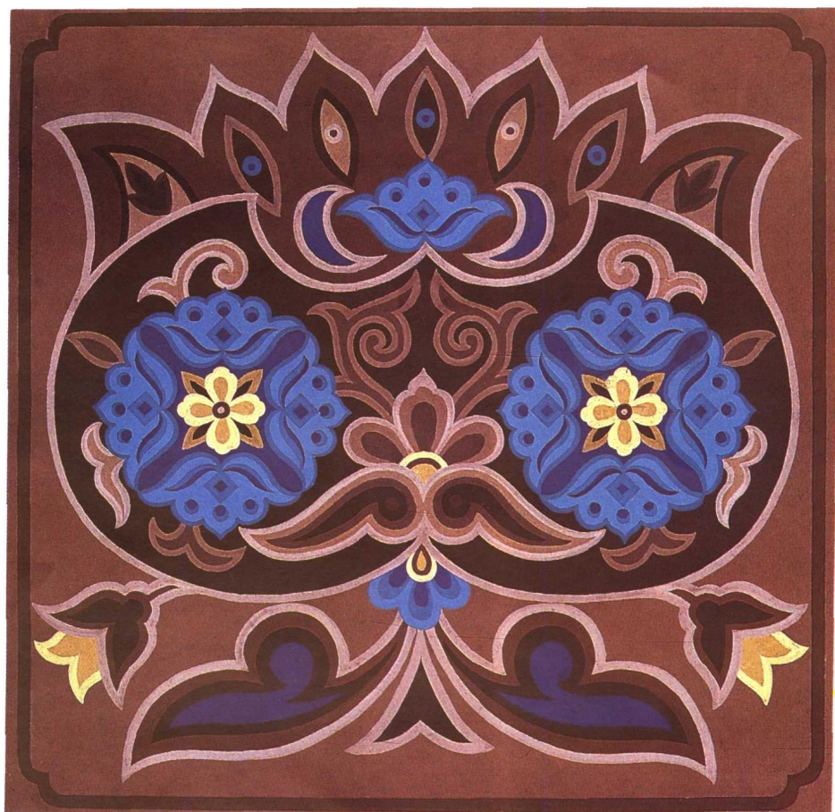
石榴花纹栽绒座垫 焉耆县