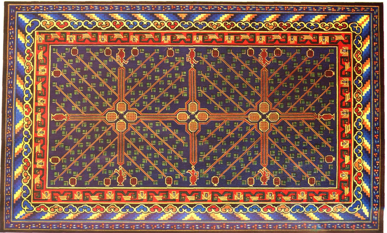
栽绒石榴花地毯(安那古丽) 和田市