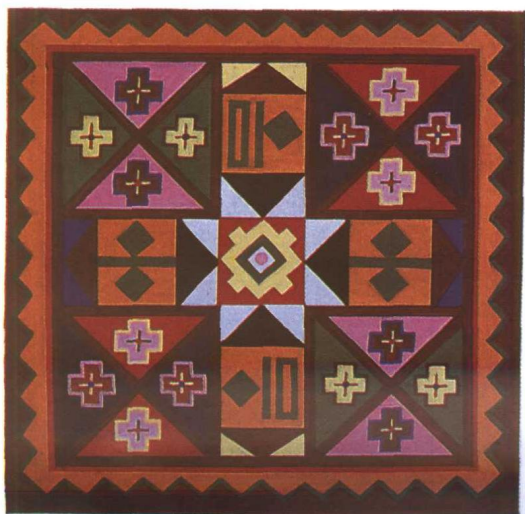
栽绒方枕顶 洛浦县