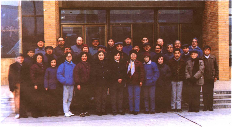
1991年12月,《汉语方言大词典》编写组成员合影。