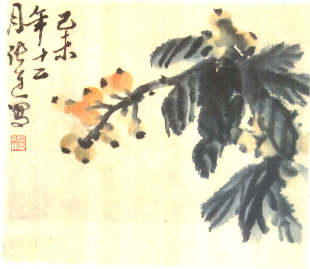
枇杷 张连 晨 张渊