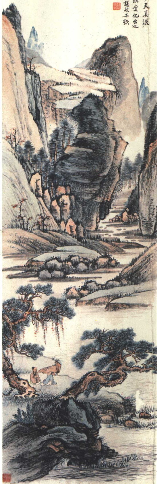
太白观泉图 馮超然