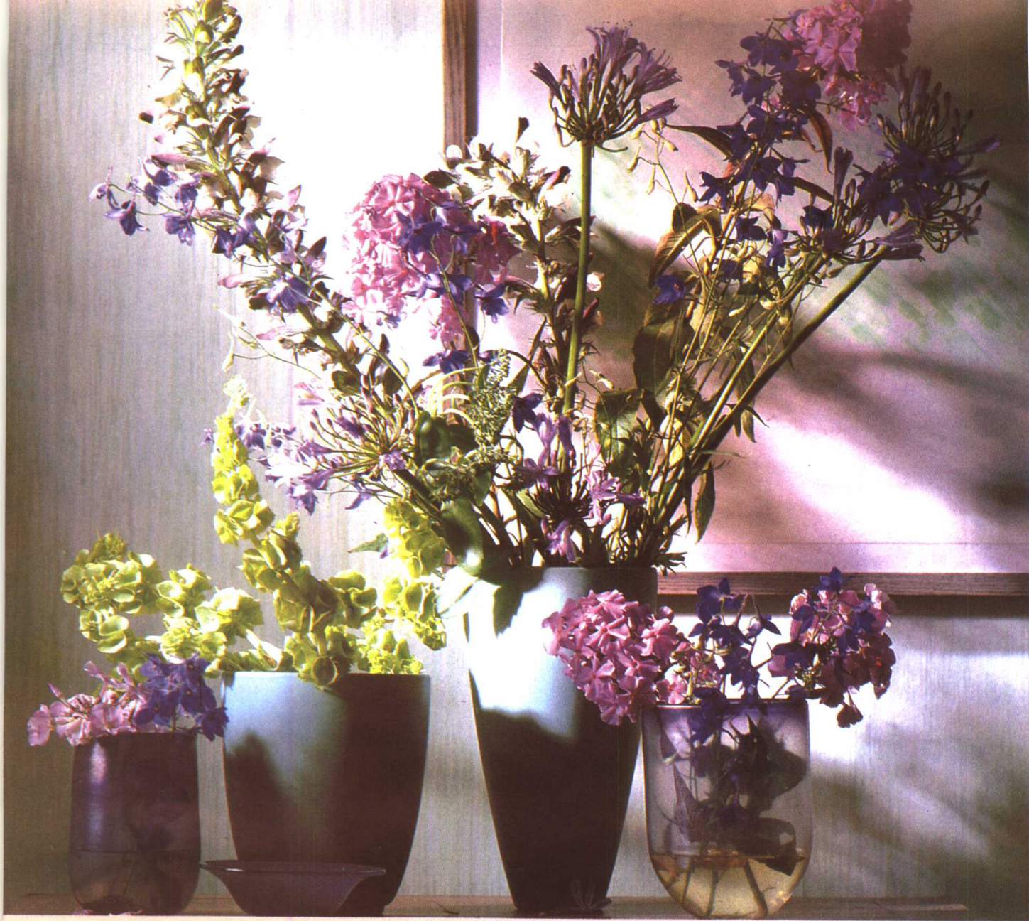
(上图)白子莲、飞燕草等同系色的组合。再插上作为重心的淡绿色植物，花瓶的颜色也与整体组合浑然一体。