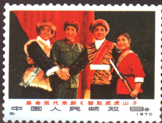
編 1-6 現代京劇《智取威虎山》