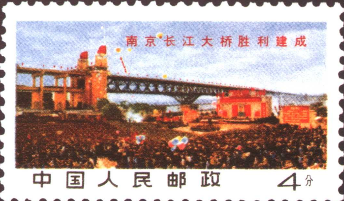
文 14 南京长江大桥胜利建成