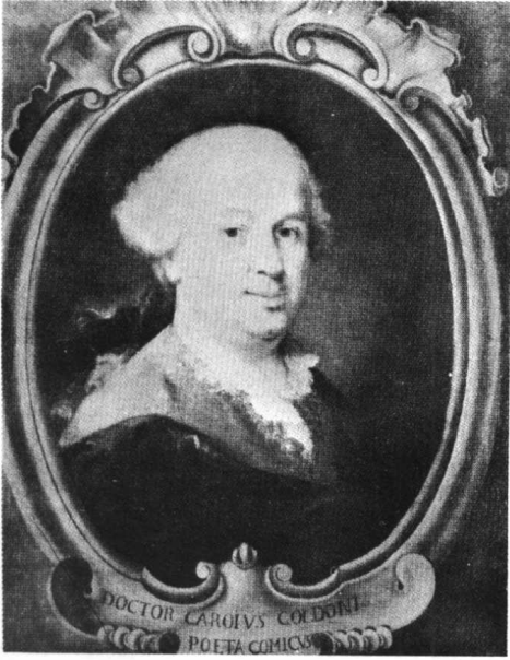
圖6 亞力山卓隆奇 (A. Longhi): 卡洛·郭德尼, 威尼斯 Correr 博物館