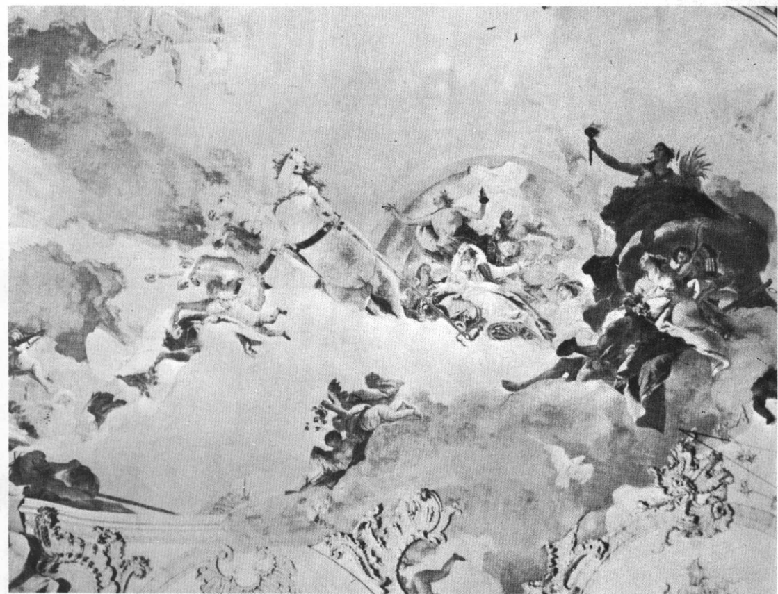
圖3 泰波羅：阿波羅帶引新娘至巴巴羅沙。符茲堡宮