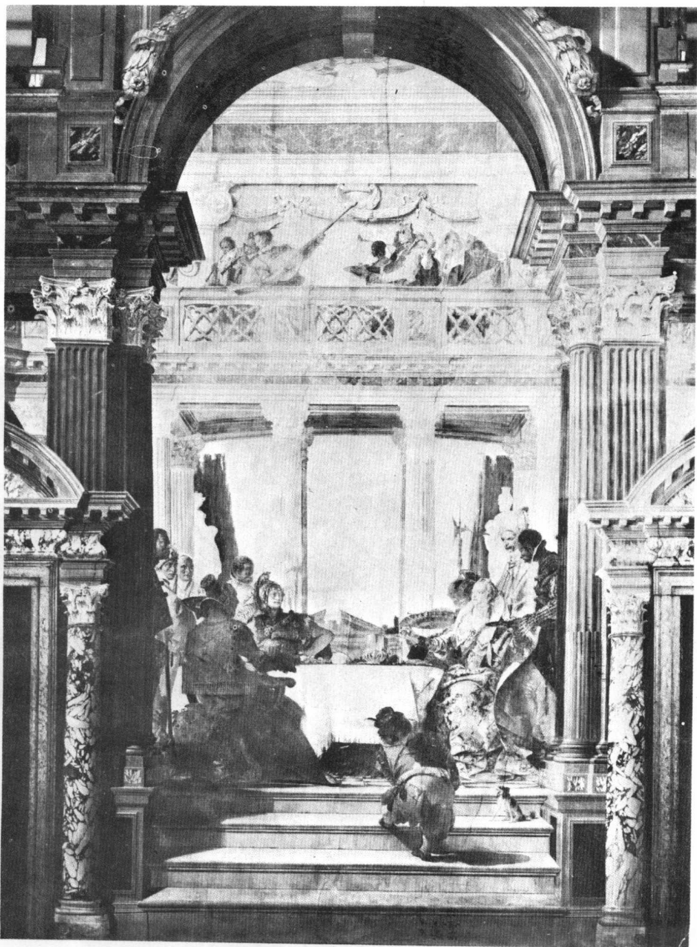
圖2 泰波羅 (Giambattista Tiepolo): 克麗奧佩特拉的酒宴。威尼斯 Labia 宮 (Rossi 攝, 威尼斯)