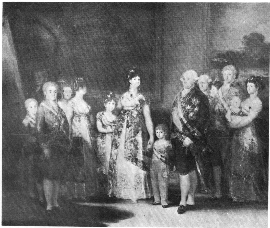
圖 9 哥耶 (Francisco José de Goya y Lucientes): 查理四世和他的家人。 馬德里，帕拉多。