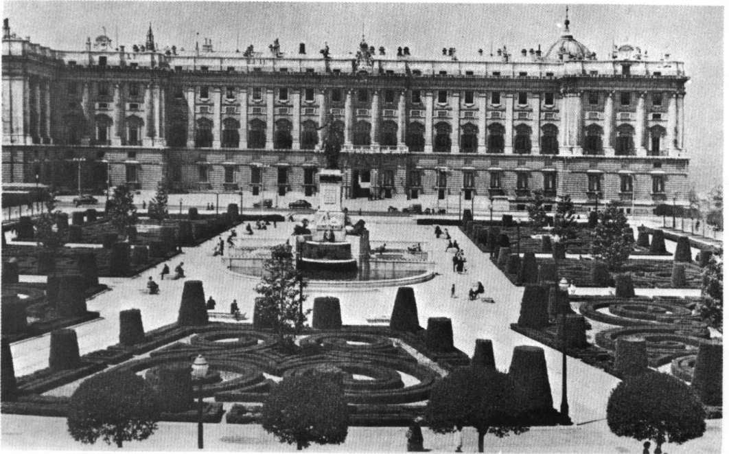
圖7 馬德里皇家宮殿。