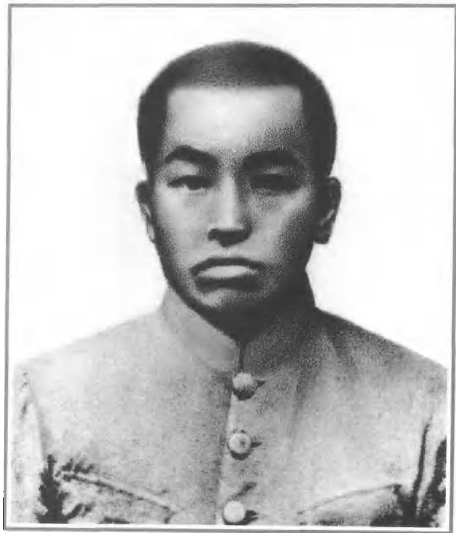
青少年时期的彭德怀。

1898年10月24日(清光绪二十四年,农历九月初十),彭德怀诞生在湖南省湘潭县乌石乡彭家围子一个贫苦农民家庭。时中国遭受着帝国主义列强的野蛮侵略和瓜分,中华大地处于山河破碎、民不聊生的深重灾难之中。由于家境贫寒,他只读了两年书即被迫辍学。童年时期,彭德怀放过牛,做过运煤童工和挑土堤工,饱尝了旧社会劳苦群众的辛酸磨难,在幼小的心灵里充满了对剥削阶级的无比仇恨和对劳苦群众的深切同情,萌发了纯朴的救贫思想,磨练出不畏强权、不怕困难的坚强性格。1913年,他在家乡参加饥民的闹米斗争,被反动当局通缉、追捕,被迫出走,到外谋求生路。