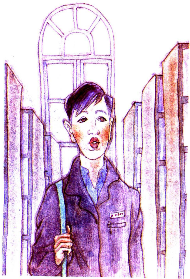
圖書館那來豬山豬海