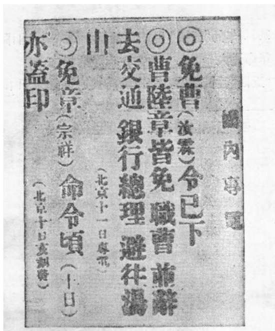
报纸登载罢免曹、陆、章职务的消息

命从旧民主主义革命时期转变为新民主主义革命时期的标志。“五四”爱国运动中，一批具有初步共产主义思想的知识分子，认识到工人阶级力量的伟大，走上同工农相结合的道路。他们在工人中开办夜校，宣传马克思主义，使马克思主义开始同工人运动结合起来，在思想上和干部上准备了中国共产党的成立。