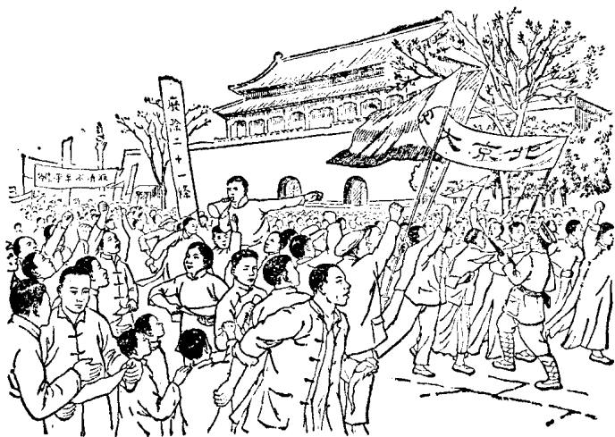
5月4日爱国学生游行示威

云霄。曹汝霖吓得躲起来了。学生痛打了正在曹宅的章宗祥，放火焚烧曹汝霖住宅。北洋军阀政府派出大批军警，镇压学生的爱国运动，捕去学生三十二人。第二天，北京学生举行总罢课。第三天，北京中等以上学校学生成立学生联合会，发出通电，呼吁全国人民起来斗争。