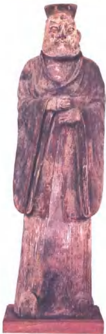
本圖是一件出土的彩繪陶俑，身穿唐王朝初年的官服。注意它的特徵：戴頭巾、長袍、寬袖（男人的寬袖，恐怕唐王朝已到極致）。