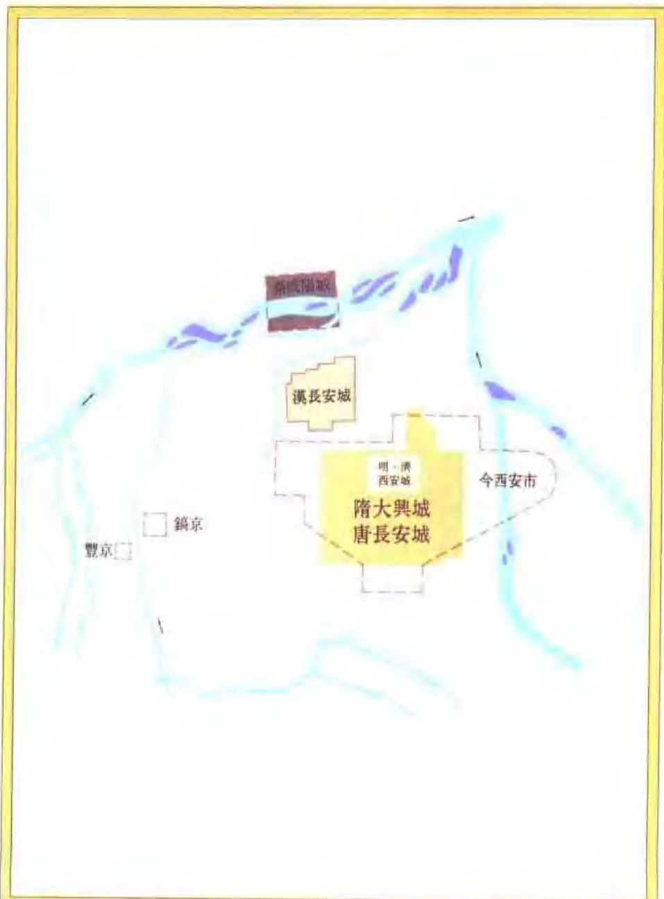
關於歷代長安的位置，我們再提供一張彩色圖片，予以說明，希望加強讀者印象。